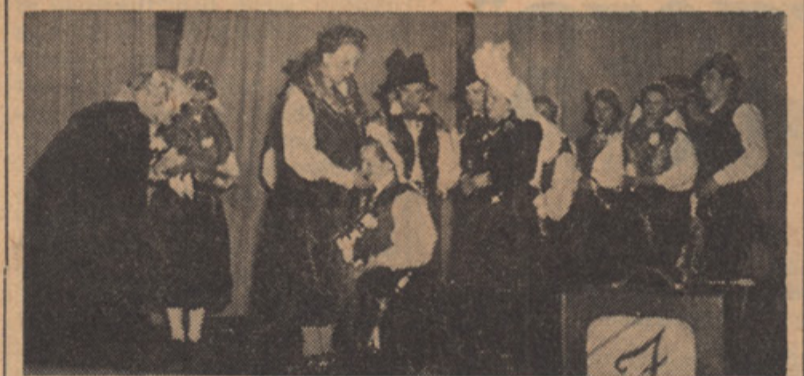
„KMEČKA OH CET“ NA PRIREDITVI SZZ V CHICAGU.

● Znani dirigent torontskega simfoničnega orkestra Sir Ernest MacMillan bo stopil po zaključku sedanje sezone v pokoj. (Can. Scene).