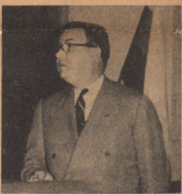
HON. CHARLES HENRY MP.