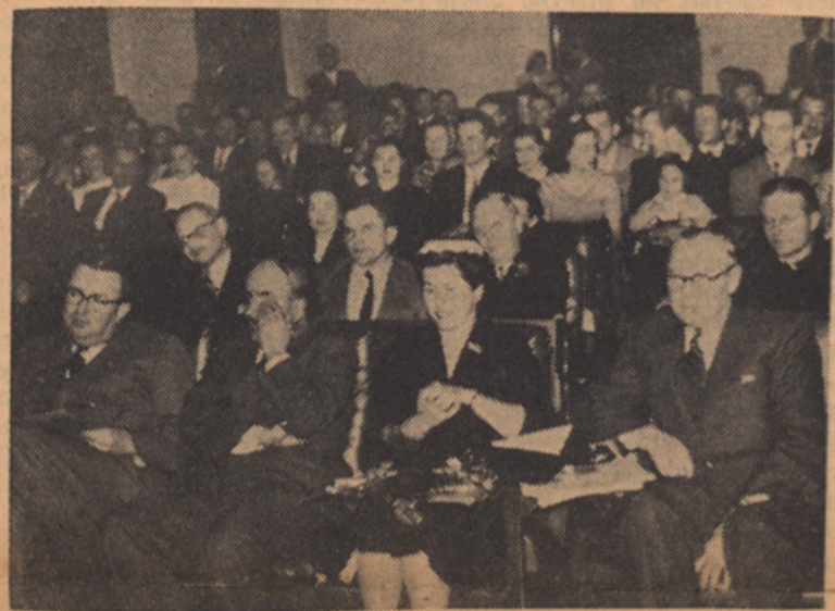
NA SESTANKU SNZ V ZAVODU. SV. MIHAELA. 16. JAN. 1955

Prepričani smo, da bo zasijalo svobodno solnce nad planinami in ravninami Sloveniji, a v tem svojem prepričanju tudi upamo, da se bo to zgodilo brez novega prelitja bratske krvi. Ko se bo kovala usoda svobodne Slovenije, pa ne bodo odločevala razna društva, marveč svetska diplomacija. Do nje bodo morali tisti, ki jim je dano živeti v svobodnih deželah zgraditi mostove, vsak po svoji možnosti. S tem pa, da sprejmemo v svojo sredino prijatelje, ki razumejo te naše težnje, polagamo prve temelje za te mostove.