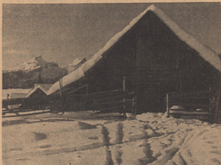
ZIMA V SLOVENSKIH PLANINAH. POKLJUKA — PLANINA JAVORNIK