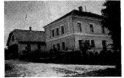
Na fotografiji: Osnovna šola Gradišče.

dogovoru z Gozdnim gospodar- stvom Maribor, da bi prevzel pa- tronat nad šolo.