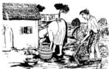
Dopust naših zaposlenih občanov