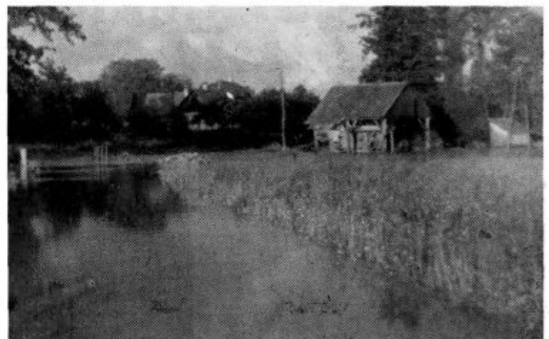
Na fotografiji: Križišče pri »Zametni vasi« z mlatilnico, last Ur- banič Janeza iz Zg. Ščavnice, ki jo je prav tako dosegla voda Ščavnice.