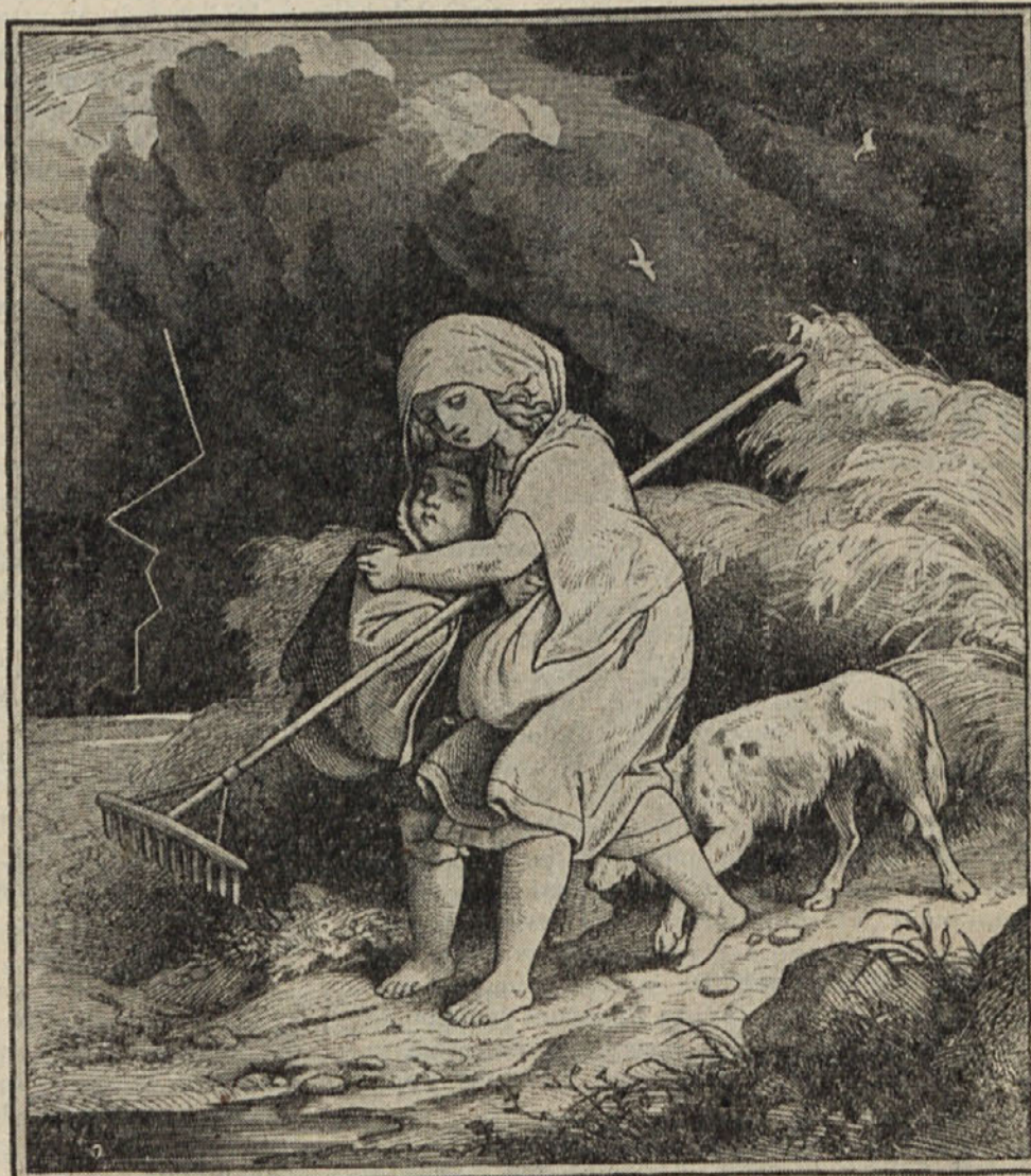
Motiv iz kmečkega življenja