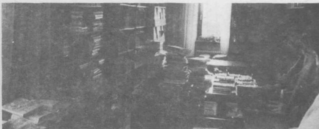
S knjigami prenatrpani prostori Splošne izobraževalne knjižnice v Grosupljem