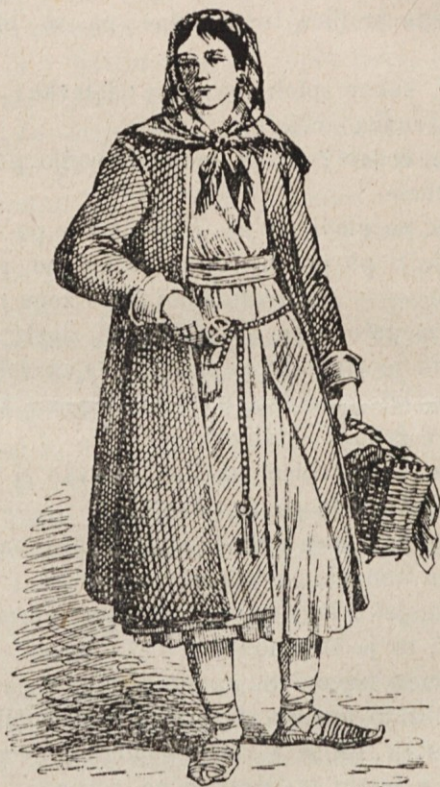
Čička v narodni noši.

protujočih si interesih. Predloge glede razdelitve volilnih okrajev na Češkem in Moravskem so se oddale poročevalcu. Zato so pričeli razpravljati o § 7, ki določa način volitve. Boj bo zopet, ko se bo šlo za dvetretinsko večino pri izpremembni volilnih okrajev. Češki listi so pisali, da bo avstrijski državni zbor razpuščen meseca januarja: nove volitve pa da bodo okrog 25. marca — Hrvaški in češki Sokoli, ki so se vračali iz vse-sokolskega izleta v Zagreb čez Reko v Dalmacijo, so bili napadeni na Reki in v Zadru od Italijanov. Mnogo oseb je bilo ranjenih. Taki dogodki pač malo pospešujejo sporazumlje med narodi. — Mnogo Čehov je prišlo v Budimpešto, da se zvežejo z Madjani za boj proti Nemcem. — Avstrij-