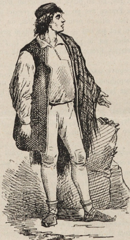
Čič v narodni noši.

Drugi kraji. Jako napete so razmere med Bolgarsko na eni in Turčijo in Grško na drugi strani zaradi protigrških demonstracij. Turčija se baje oborožuje. — Napadi na p. licijo, na vojaške straže in visoke dostojanstvenike na Ruskem se ponavljajo. Ministerstvo Stolipinovo je izdalo svojo programatično izjavo, v kateri pravi, da hoče nadaljevati na potu upeljavanja liberalnih reform in