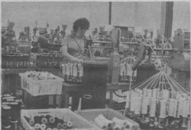
Detalj iz TOZD Pozamenterijskih izdelki

Med pripravami na proslavo naj omenimo športna tekmovanja, ki jih je pripravila komisija za sport in rekreacijo pri OOS Totre. Tekmovale so ekipe delovnih kolektivov KTM, Pletenina, Sava Kranj, milica Moste in se-