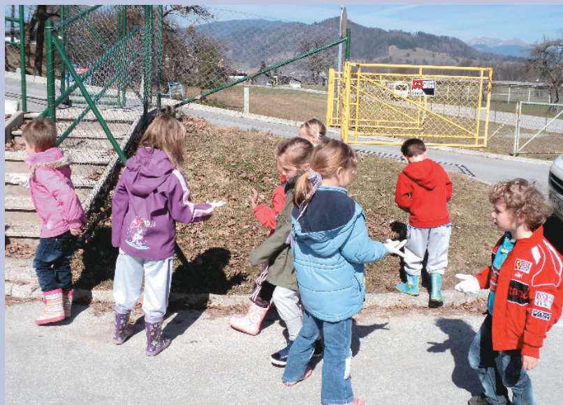
Lanska čistilna akcija v blejskem vrtcu.