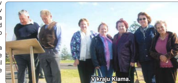
V kraju Kiama.

Obisk slovenskih rojakov in Slovenskega društva Planica v Figtree. Od Slovenskega društva v Wetherill Parku smo se na pot podali v soboto,