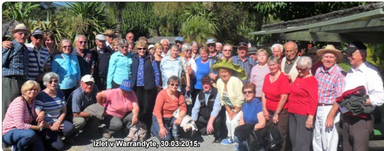
Izlet v Warrandyte, 30.03.2015.