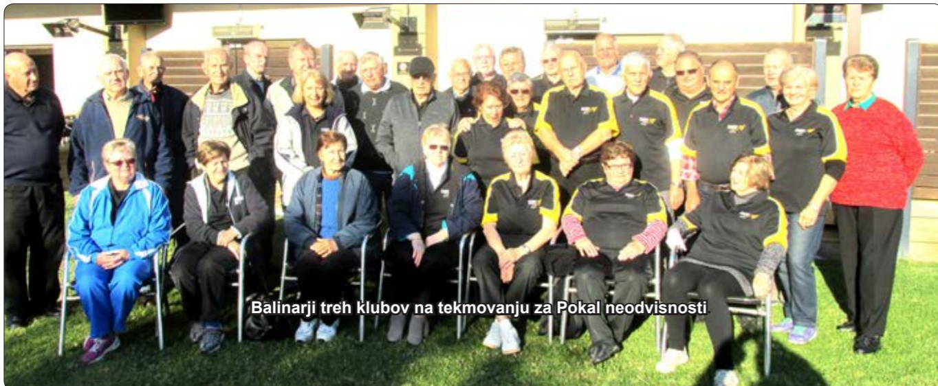
Balinarji treh klubov na tekmovanju za Pokal neodvisnosti