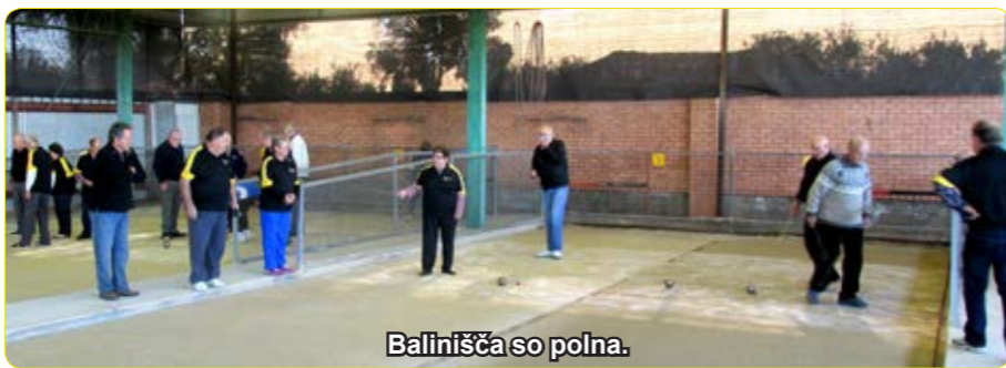
Balinišča so polna.

je Oddelek za vzdrževanje matičnega kluba Mounties zamenjal vse žlebove Kluba Triglav, je bilo potrebno popraviti balinarske steze naših balinišč, ki so bile pogosto ob velikih nevihtah popolnoma poplavljene. Še posebno pomembno je bilo popravilo balinišč, ker število balinarjev na triglavskih baliniščih narašča. Prijetno prijateljsko vzdušje, dobre nagrade in splošni ugodni pogoji pritegujejo balinarje iz sosednjih sorodnih klubov, da dvakrat na teden napolnijo balinišča Triglava. V soboto, 6. junija, so se zbrali na Triglavu balinarji iz Slovenskega društva Sydney, Planice Wollongong in domače moštvo Kluba Triglav, da bi se pomerili za pokal slovenske neodvisnosti na celodnevem tekmovanju. Zjutraj je bilo že tako hladno, da smo morali prižgati plinske grelce, nato pa je nastal lep sončen dan. Posladkali smo se z domačim pecivom, ki so