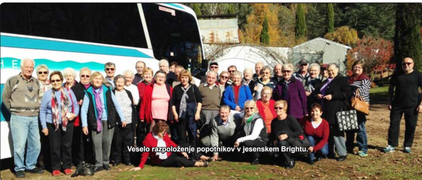
Veselo razporeženje popotnikov v jesenskem Brightu.

Neutrudno delata na postoralnem kot tudi na komunikacijskem področju. Dvomesečnik »Misli«, ki ga izdajata, ne podaja le misli, ampak tudi povezuje rojake med sabo in z domovino Slovenijo. Vse, kar se dogaja v slovenskih centrih v Avstraliji in v slovenski Cerkvi, izveš iz njega. Fotografije so zelo zgovorne. Avstralska skupnost Slovencev je res živa. Med drugim se iz »Misli« izve, da je pri njih veliko pogrebov, kar se pozna pri nedeljskih mašah. Ko sem bil prvič pred trinajstimi leti na obisku v Melbourne, je bila cerkev polna, sedaj so