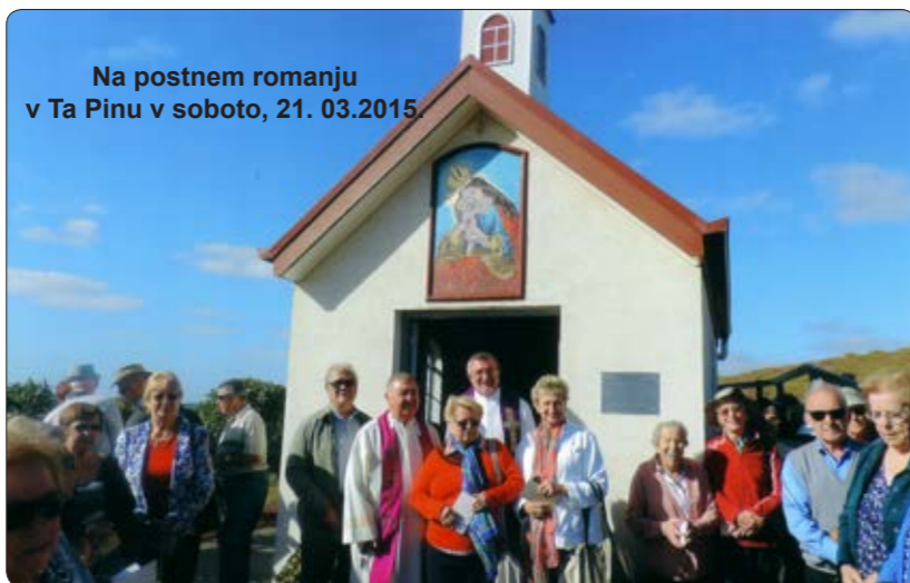
Na postnem romanju v Ta Pinu v soboto, 21. 03.2015