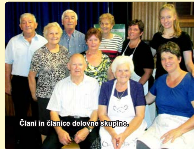
Člani in članice delovne skupine.