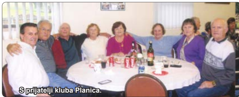
Sprijatelji kluba Planica.