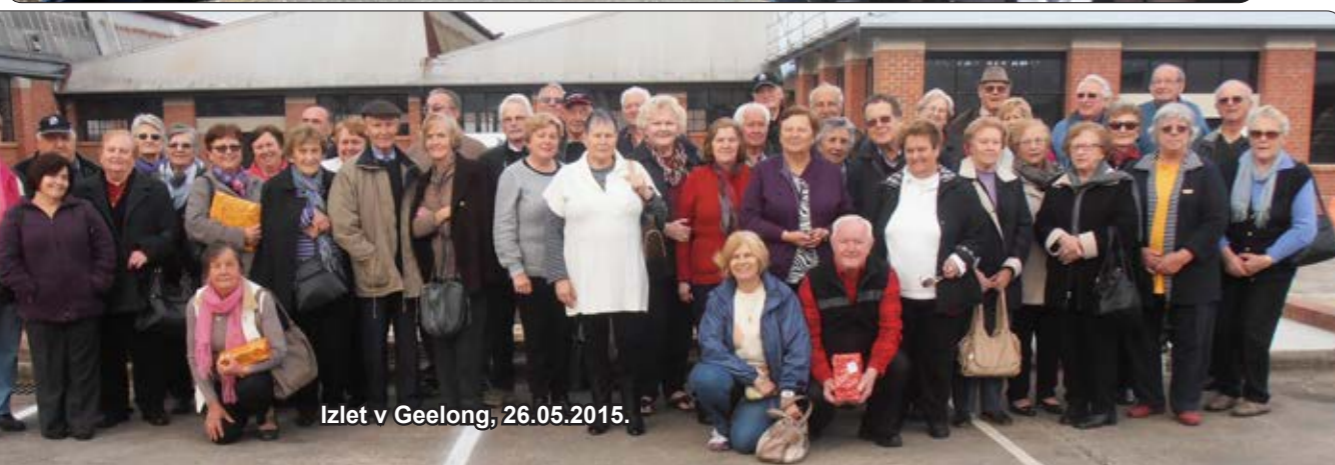
Izlet v Geelong, 26.05.2015.