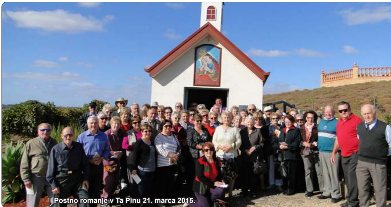
Postno romanje v Ta Pinu 21. marca 2015.