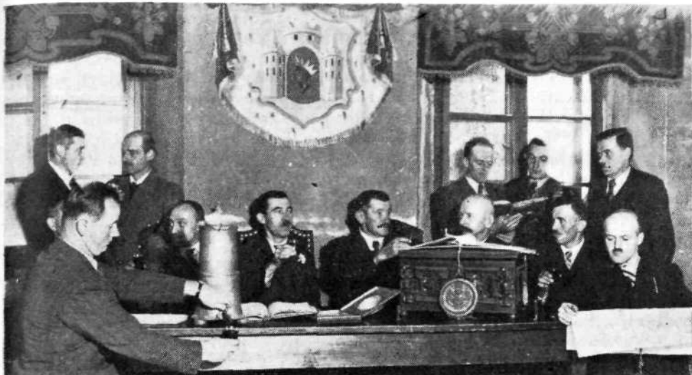
Škofjeloški kovači in ključavničarji so se sestajali v svojem cehu še pred zadnjo vojno (Original v loškem muzeju.)

In zapovedujemo nato vsem in vsakomur, našim podrejenim cerkvenim in posvetnim oblastem, namestnikom, glavarjem, vicedomom, upraviteljem in skrbnikom, deželnim oskrbnikom, županom, sodnikom, svetnikom, meščanom, občanom in vsem drugim našim uradnikom, podanikom in zvestim, s tem pismom resno in odločno in hočemo pri zgoraj imenovanih umetnih, fužinskih, žebljarskih, sekirnih kovačih, ključavničarjih in njihovih potomcih na tem obrtnem redu, ki je od njih prepisan in smo ga milostno potrdili, vztrajati, dokler bodo ostali pri rimsko-katoliški cerkvi in pri obljubljeni službi božji, da jih bomo ščitili, varovali in branili in pustili, da se po njih ravnajo in ostanejo mirni, da jim ne bomo delali težkoč in ovir niti na noben način dovolili drugim, komur je naša naklonjenost ljuba in se hočejo izogniti težki kazni in naši nemilosti, da bi to delali.