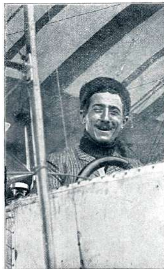
PAULHAN OB KRMILU SVOJEGA AEROPLANA

Danica. Koledar i letopis društva svetojeronimskoga za godinu 1910. — 8 o , str. 358. Cena 40 vinarjev. Ta najbolje urejevani in najbolj razširjeni hrvaški koledar je tiskan letos v 50.000 iztisih, a druge društvene knjige v 30.000 iztisih. Po koledarskem delu so natisnjeni društveni poverjeniki in novi člani, ki so se zapisali v društvo leta 1908. V članih pokazalo je društvo lep napredek, kakor ni bil še nobenega leta; letnih članov, ki plačajo na leto eno kruno, zapisalo se je 9000, za 2500 več kot l. 1907., a dosmrtnih članov 1094, za 412 več kot prejšnjega leta. Iz društvenega letopisa izvemo, da je bilo v društvu mnogo življenja in da je odbor vestno izvrševal svoje dolžnosti in skrbel, da člani dobe mnogo in zdravega berila, in se trudil, da društvo med Hrvati čim bolj razširi. Društveni zakladi se lepo množe, sedaj je že 17 zakladov, katere so razni domoljubi osnovali za nagrado piscem in pa zato, da se vsako leto v raznih krajih vpiše v društvo nekoliko novih dosmrtnih udov. Ti zakladi štejejo skupaj 43.100 K 59 v, a vse društveno premoženje znaša 307.246 K 4 v.