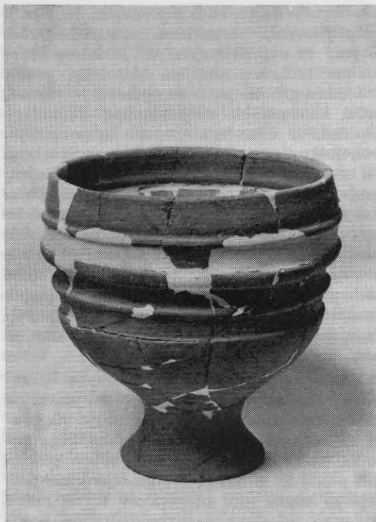
Sl. 2. Oblike poznokeltskih lončenih posod (1. stol. pred n. š.)

domačih keltskih lončarjev (sl. 2) so sive dvoročajne posode, svetlosive in rjavordeče bikonične stekleničaste posode ter sivočrni kroglasti lonci z narebrenim vratom. Ti lonci so skoraj vedno bili najdeni skupaj s keramično čašo — v večini primerov je bila čaša v loncu — kar kaže na priljubljeno pivsko garnituro pri Latobikih. Iz domačih lončarskih delavnic so tudi precej grobo izdelani lonci in čaše iz rjavosive porozne gline, ki so vedno okrašeni z metličastim ali glavničastim okrasom. Značilna domača lokalna oblika lončenine so precej visoki »pokali« s širokim narebrenim zgornjim delom in precej ozko stojno ploskvijo. Te nenavadno oblikovane, pokalom podobne posode (najbrž posode za pijačo) so doslej znane samo iz štirih, razmeroma blizu ležečih najdišč v deželi Latobikov: v Novem mestu, Verdunu pri Stopičah, Beli cerkvi in v Mihovem. Pozno-latensko gradivo iz 1. stoletja pred n. š. dopolnjujejo še različne železne in bronaste fibule-zaponke, okrašena železna pasna plošča (sl. 3) in redki grobovi z orožjem (sl. 4). Dva keltska srebrnika 10 tako imenovanega samoborskega tipa, najdena v Novem mestu, kažeta na prve začetke denarnega gospodarstva v teh krajih.