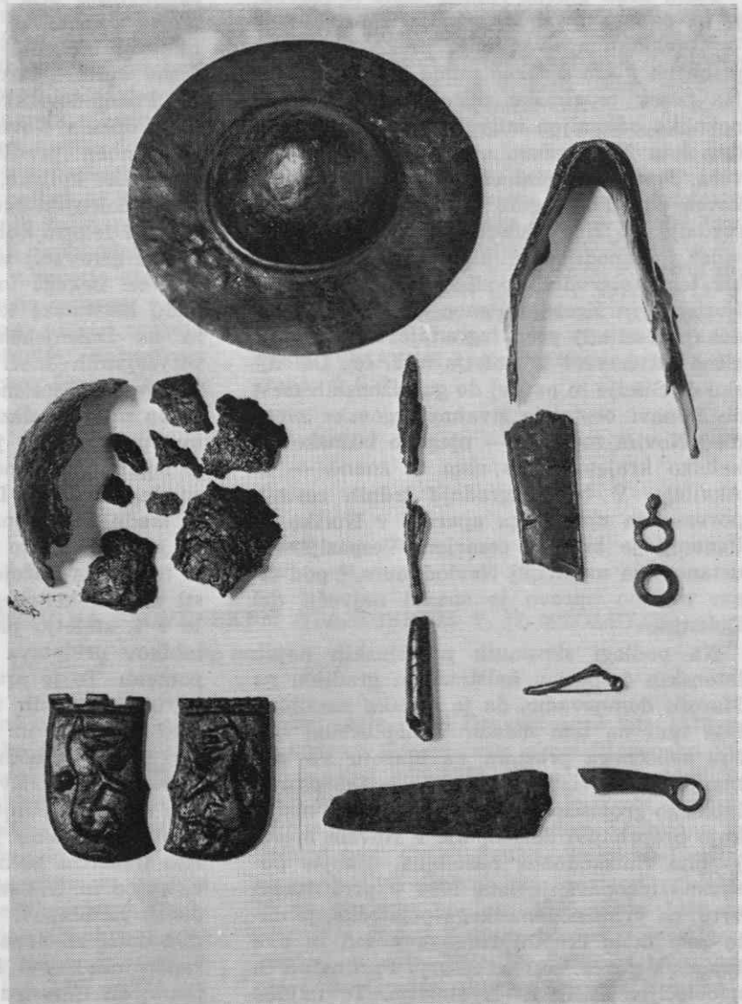
Sl. 4. Železno orožje iz groba keltskega bojvnika (1. stol. pred n. š.)

ga časa v jugovzhodni Sloveniji. To so znamenite lončene hišaste žare, ki so jih uporabljali za shranjevanje pepela pokojnih. 12 Razširjenost te svojevrstne grobne keramike v 1. in 2. stoletju n. š. na določenem delu Zgornje Panonije je jasno začrtana in razmeroma majhna: od Mirenske doline na severu do Žumberka in Kolpe na jugu ter od Trebnjega na zahodu do Zagreba na vzhodu. Te, povečini rdeče barvane posode v obliki okroglih hiš s široko odprtino vrat spredaj in ozkimi okenskimi režami ob straneh, se na vrhu strnejo z gumbastim zaključkom, včasih tudi s plastično oblikovanim petelinom. Podoba te živali ima simboličen pomen: njena čuječnost oznanja rojstvo novega dne, v prenesenem smislu vstajenje v novo življenje po smrti na tem svetu. Iz vzorcev rdeče poslikave na hišastih žarah smemo morda