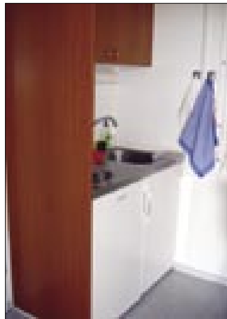
Mala, prilična künja

»Zdaj se mi že sploj fejst vidi. Na začetki sam pa sploj čüti nej stejla od tauga. Dja sam v staroj kuči stejla ostati, dapa