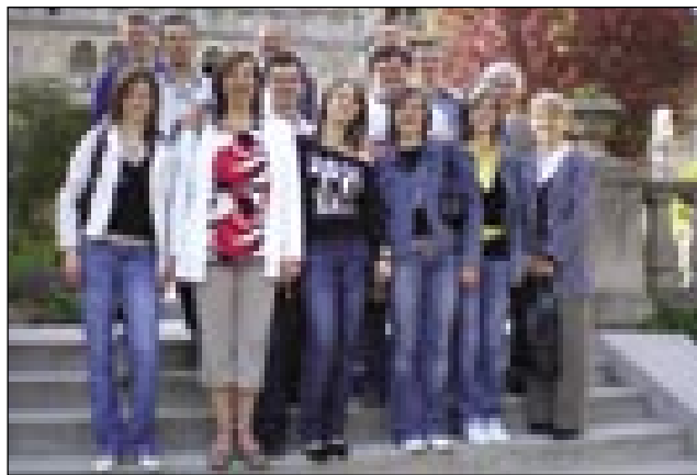
Z gostitelji, člani Slovenske samouprave, na ogledu mesta

bili so karažni, plesali so z nasmejanimi obrazi, pari so pazili na eden drügoga pa so djuvkali, kak se šika. Mladi Sakalauvcarge so se zavedali, ka njini program v Székesfehévári predstavla slovensko manjšino na Vogrskom. So rejsan vödjali zasé! Mislim, ka zvöjn méne je najbola vese-