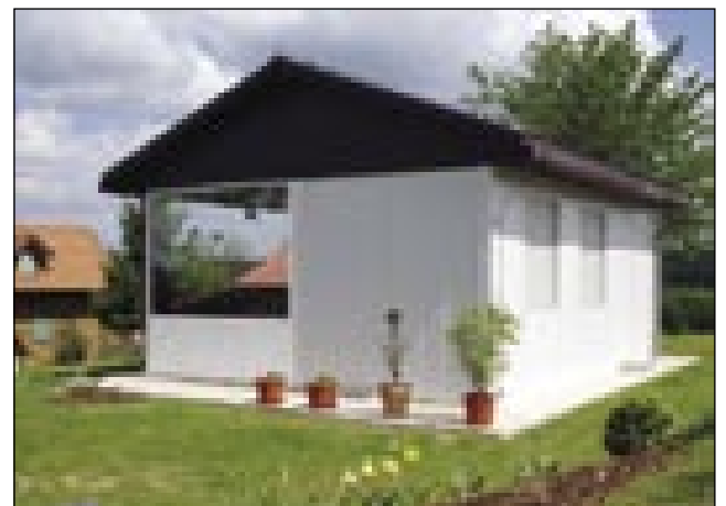
»Kontenerska« iža od zvüna

• Kak je bilau, gda so vam staro kučo rüšili?