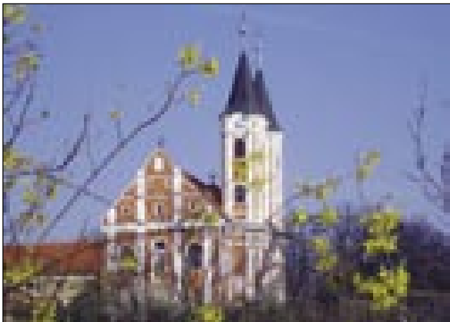
Cerkev v Máriagyúdu