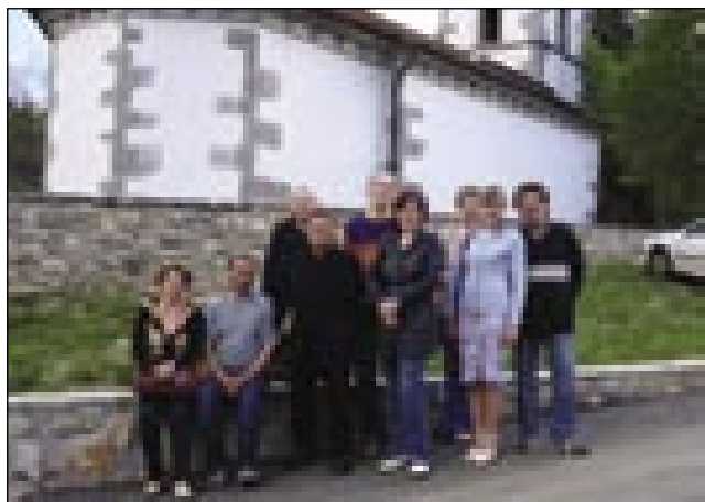
Pri kapejli v Gradci

je trbelo dosta čakati. V pau sedmoj smo prišli v Gradec. Naši gostitelji so nas že čakali. Istina, ka je glavni organizator ešče v delavnom gvanti bio, mislili smo, ka je kakšni pomočnik ali je prišo z njive. Kak nam je pravo, prireditev bo »domača«, tak mo se ležej