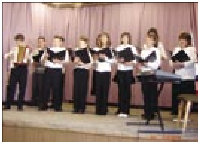
Šaularji z Gorenjoga Senika so spejali kak slavički

so se napotili na ves k babici, ka bi ga njej pokazali. Dočas so prišli do nje, se je njim dosta božnoga zgodilo. Po nikši nevolaj so rejšili probleme in