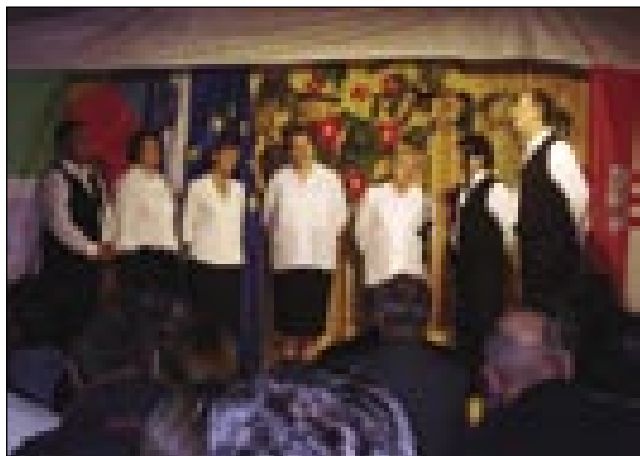
Gorenjeseniški ljudski pevci na odri

šli na paut, vej je pa vremen to pomagalo nam, ka je lejpi cajt bio. Po dugoj pauti smo se dvakrat stavili, ka bi si malo noge vövtegnili, v dosta mestaj so ceste popravljali in