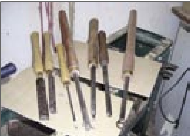
Naužicke za struženje

bilou prikazano, vse bole takše bilé: ameriške, angleške, avstralske, novozelandske... Tak ka se je od tujih meštrov včiu. Strugarji iz tej držav nikaj ne skrivajo, vse predstavijo, kak ka napraviti. Vsakši izdelek, ka ga napravijo, je pa eden edini, se pravi unikat. Tüdi če bi ščele