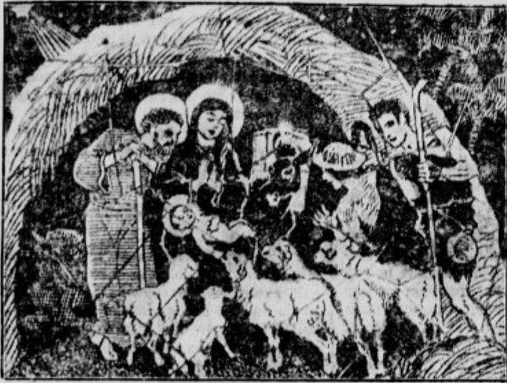
Dobro sestavljena slika.