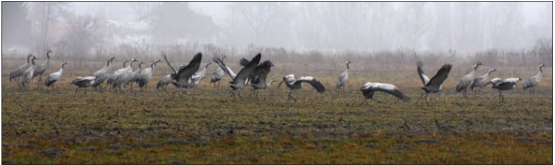
Slika 5 / Figure 5: Žerjav / Crane Grus grus, 24.1.2009, Ljubljansko barje.