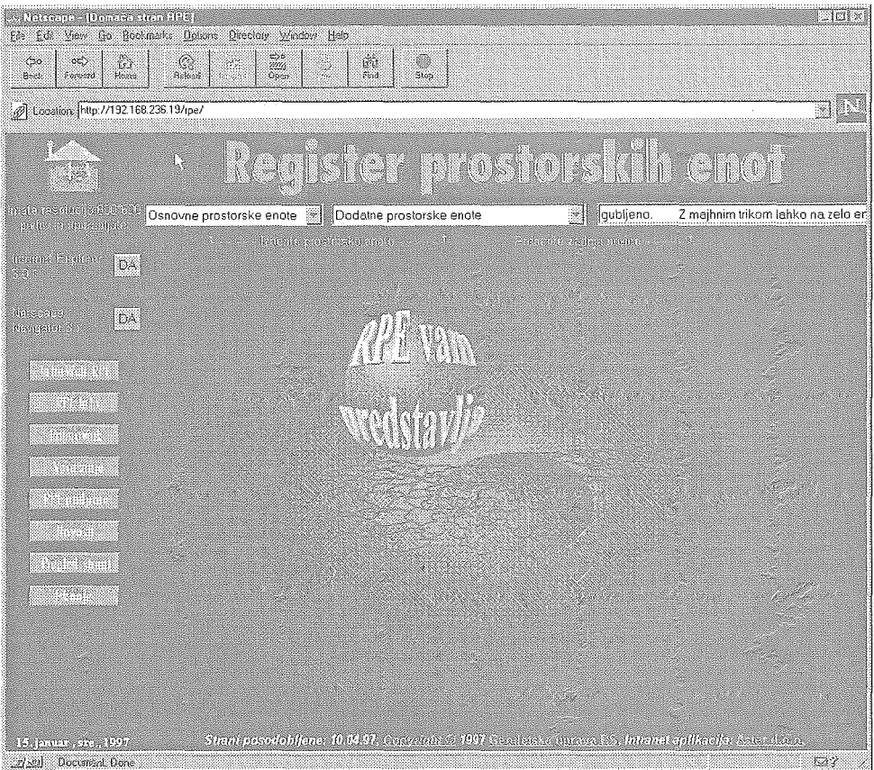
Naslovna RPE stran

Oddelek za Register prostorskih enot z velikim zadovoljstvom obvešča odprtje domačih strani registra prostorskih enot (RPE) na Intranetu. Vse hitrejši razvoj tehnologije spleta (web), tako za potrebe Interneta kot za potrebe Intraneta, in vzpostavljena uporabniška baza RPE-ja na Centru vlade za informatiko sta omogočila, da smo pripravili domačo stran RPE-ja na Intranetu. Strani se nahajajo na strežniku Intranet Centra vlade za informatiko in so trenutno dostopne posameznim uporabnikom znotraj državnega komunikacijskega omrežja.