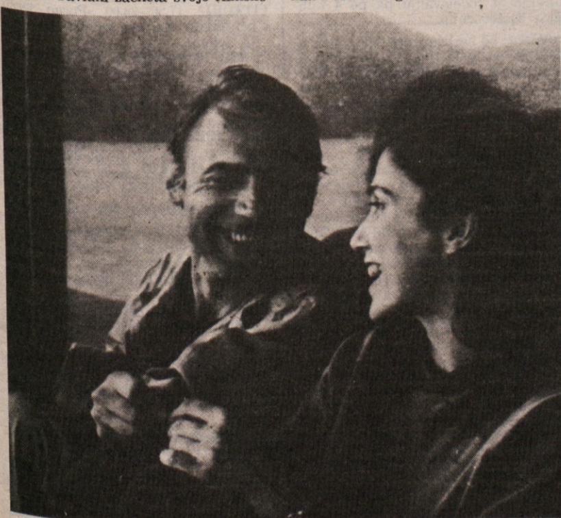
Iz filma »V belem mestu«

6.00, 6.30, 8.00, 11.00, 12.00, 14.00, 19.00 Poročila; 6.20 Rekreacija; 6.45 Prometne informacije; 7.00 Druga jutranja kronika; 7.25 Dobro jutro, otroci!; 7.35 Prometne informacije; 7.50 Iz naših sporedov; 8.05 Pionirski tednik; 9.00 Pojte z nami; 9.20 Matinejski koncert; 10.05 Po republikah in pokrajinah; 10.25 Dopoldne ob lahki glasbi; 11.30 Srečanja republik in pokrajin; 12.10 - 14.00 Naši poslušalci čestitajo in pozdravljajo; 12.30 Kmetijski nasveti; 13.00 Danes do 13. ure; Iz naših sporedov - Iz naših krajev, osmrtnice, obvestila in zabavna glasba; 14.05 Glasbena panorama; 15.00 Radio danes, radio jutri; 15.10 Obvestila in zabavna glasba; 15.30 Dogodki in odmevi; 15.55 Zabavna glasba in obvestila; 16.00 Vrtiljak; 17.00 Studio ob 17. uri - Zunanje politični magazin; 18.00 Škatlica z godbo; 18.30 Mladi mladim; 19.25 Zabavna glasba in obvestila; 19.55 Za naše najmlajše; 19.45 Minute z ansambлом Bojana Adamiča; 20.00 - 23.00 Oddaja za Slovence po svetu; Mladi mostovi; Domočina je ena; 23.05 Literarni nokturno; 23.15 Od tod do polnoči; 00.05 - 5.00 Nočni program - glasba.