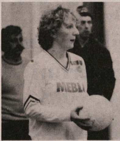
Kapetanka Mebla Lia Legiša naše igralkle odigrale morda svojo najboljšo letošnjo tekmo in prepričljivo

Prvi dve letošnji srečanja med Meblom in Moglianom le potrjujeta napoved, da utegne biti nocojšnje srečanje zelo zanimivo. V Moglianu so