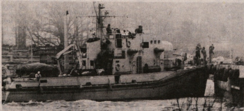
Švedska vojna ladja išče »vsiljivca«

Švedska uradno ne dolži nikogar, da vohuni v njenih ozemelskih vodah, vsakomur pa je lahko jasno, da so to lahko le države vzhodnega bloka. Obale nevtralne švedske imajo namreč izreden strateški pomen za vse podmorske enote vzhodnega bloka, ki se morajo prebiti iz Baltskega morja v Atlantski ocean.