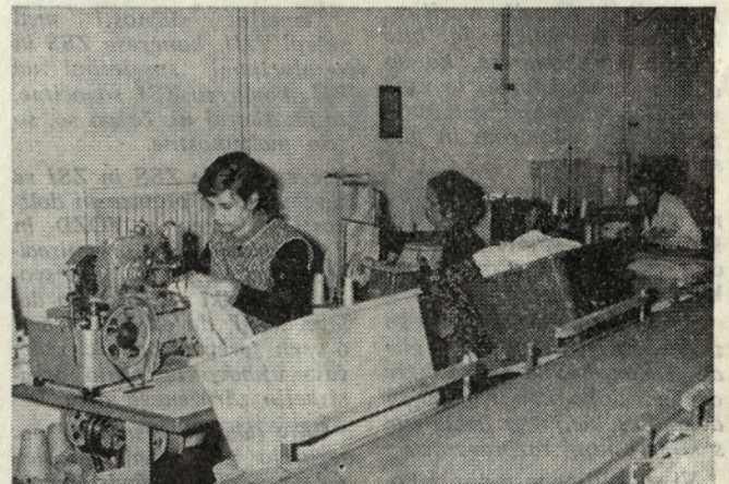
Sivanje ob traku v novi novogoriški tovarni