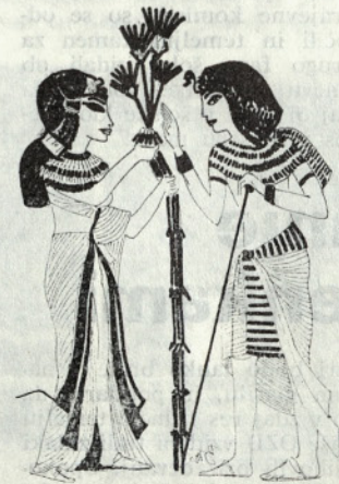
Bogata oblačila faraonov iz nove države

Egipčani so se brili po telesu in po glavi in zato je bila že v stari državi v modi čela vrsta manj ali bolj imenitnih lasulj, najbolj umetelne med njimi pa najdemo v novi državi.