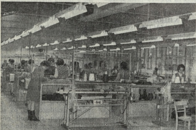
Pletilnica v novi novogoriški tovarni