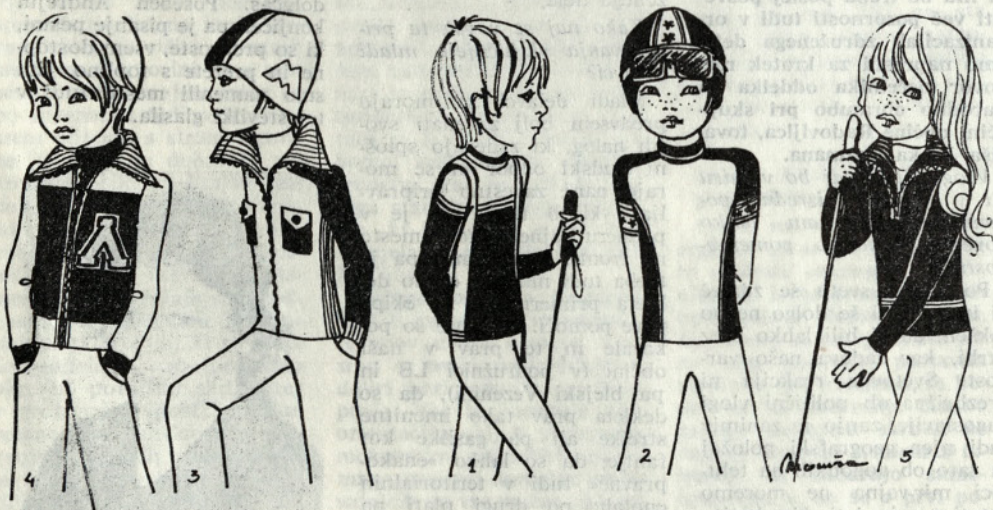
Pisani in ljubki modeli za mraz in veter

Veliko sreče in potrpljenja! Maruša Černilec