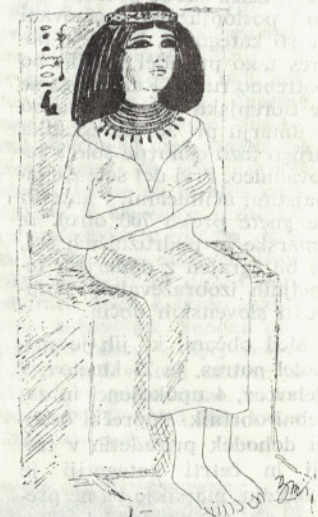
Belo oblačilo in pisana ogrlica iz stare države

Pa se najprej pomudimo v Egiptu, kjer se moda v obdobju vseh treh držav, (stara država od 2653—2163, srednja država od 1991—1771 in nova država od 1552—1071 pred našim štetjem) ni bi-