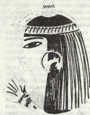
Naglavno okrasje in dišavni stožec

Izredno bogata pa so bila oblačila vladarjev in njihovih družin, ki jih zmeraj dopolnjuje čudovit nakit.