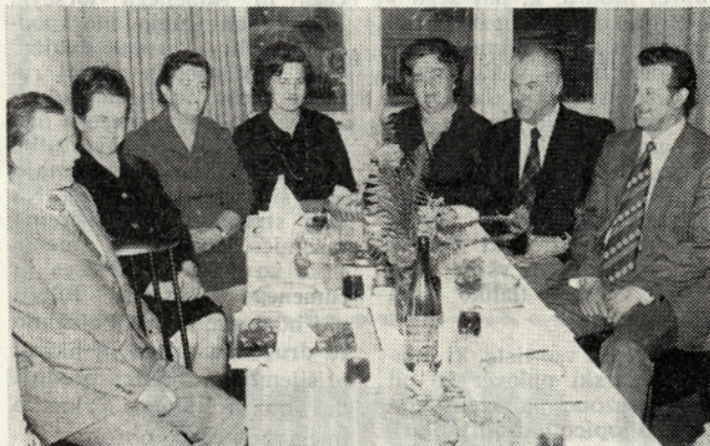
Srečanje z upokojenkami

Po prijetnem srečanju so predstavniki naše OZD zaželeli vsem trem še zadovoljno in zdravo 1975.