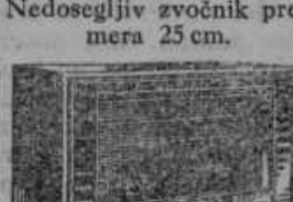
D 707 WKK