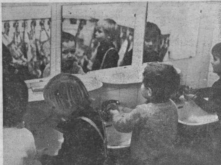
Snaga je hudo potrebna reč in tudi ni da bi delali sramoto staršem, ki so v službi na kliničnem centru

Ko sva s kolegom fotoreporterjem stopila v novi montažni interni vrtec Kliničnih bolnic, se nisva nadejala, da se bova tako težko poslovila od prijaznih vzgojiteljic in rdečeličnih, čeprav nekoliko sramežljivih otrok. V šestih igralnicah in ostalih prostorih, od kabineta s klavirjem do umivalnic s pisanimi brisačami, kozarčki in zobnimi krtačkami, sva se počutila kakor v deželi palčkov, v kateri ni prostora za neprijetne misli in vsakdanje skrbi.