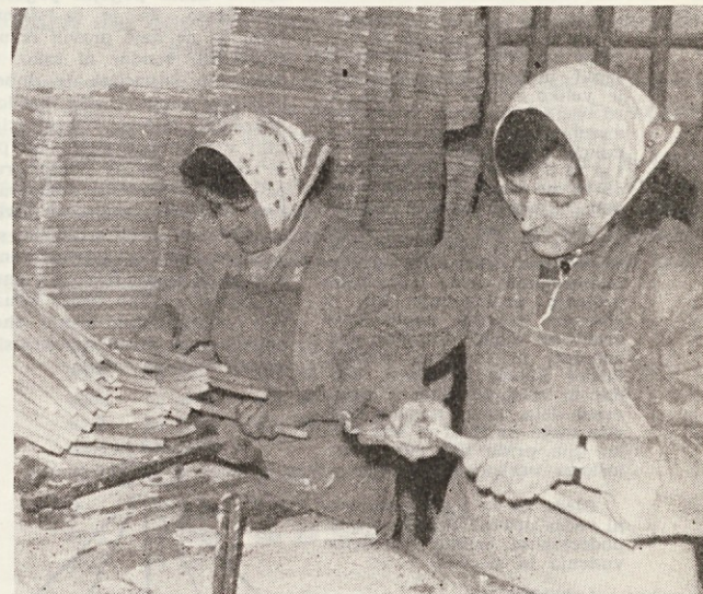
Lepljenje obešalnikov v obratu Podpeč

ZANIMIV JE PREREZ POSAMEZNIH POSTAVK V REŽIJSKI URI