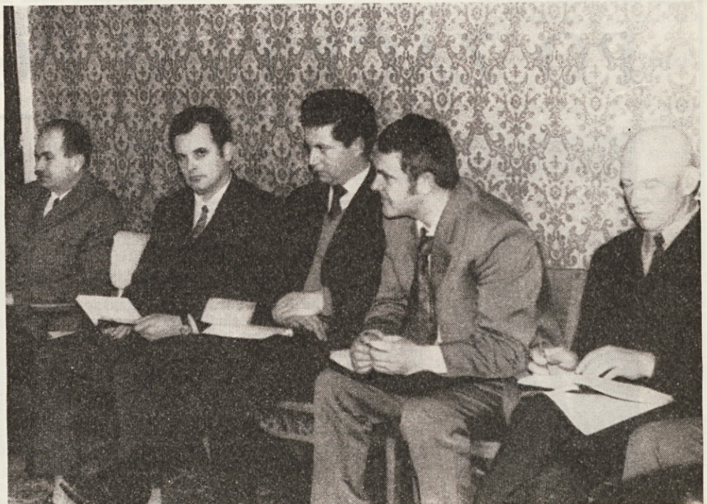
Strokovni kolegij našega podjetja med razpravo o lanskoletni bilanci