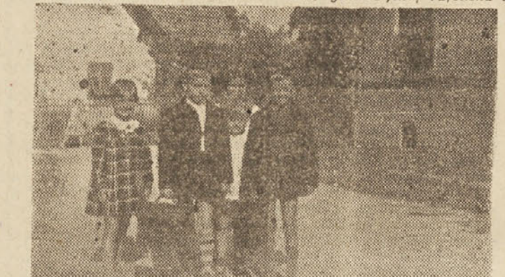
Te dni so se spet odprla solska vrata; z negotovimi, malo zaskrbljenimi koraki so se naši malčki znova napotili v »hram učenosti«...

Brežicah pred dnevi sestali in-iclativni odbor za ustanovitev Društva prijateljev mladine. Razmišljal je o mnogočem, kar je potrebno naši mladini, da bo telesno in duševno dobro uspevala.