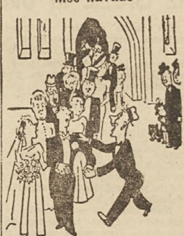
»No, servus prijatelj, kaj bova pa nočoj počenjajla?«