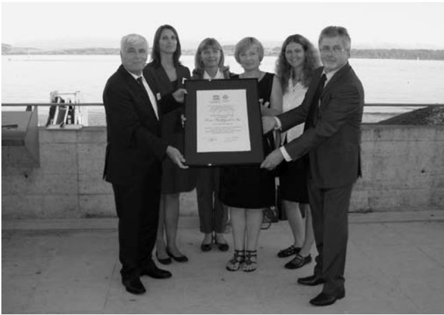
Slovenska delegacija na slovesnosti v Neuchatelu (predstavniki Občine Ig, ZVKDS, MK in slovenskega veleposlaništva v Bernu).