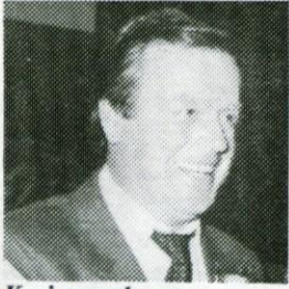
Krajevna skupnost Primskovo