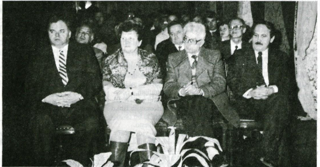
Osrednji republiški proslavi ob tristoletnici izida Valvasorjeve Slave vojvodine Kranjske na gradu Bogenšperk so prisostvovali tudi številni gostje

Za boljše obveščenost ljudi smo pripravili poseben znak (štampljka, kuverte, plakati, priponke) in skušali tudi v sredstvih javnega ob-