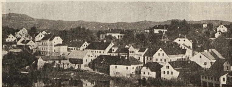
Novo mesto - Kandija.

postalo vojaško zbirališče Krajine, zato so v Karlovec preselili vojaška skladišča ter skoraj vse civilno in vojaško uradništvo. Leta 1584. je pogorelo zopet skoraj pol mesta, leta 1605. pa 56 hiš. 72 Poleg vseh teh nesreč pa je leta 1599. razsajala še kuga, ki je uničila v Novem mestu še preostalo trgovino in obrt, kajti za kugo je umrlo nad 800 ljudi. 73