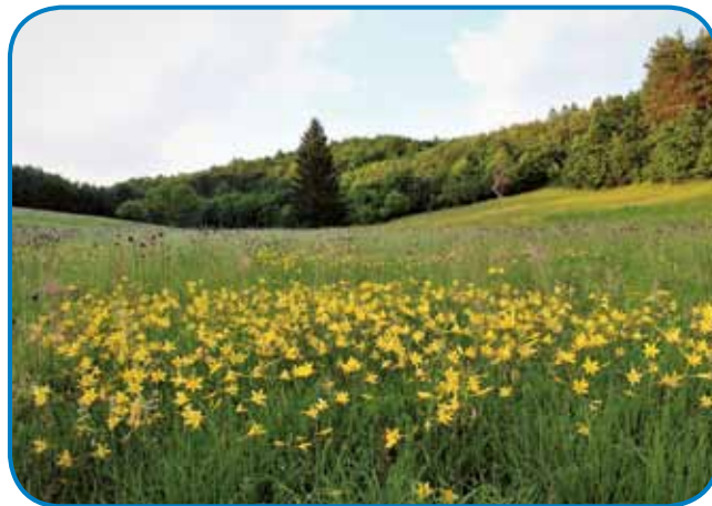
Najlepše rastišče rumene maslenice v otkovski dolini

žico, rumeno maslenico, ki je na rdečem seznamu ogroženih rastlin, to pomeni v popolnem izgubljanju, kar opažam skozi leta tudi sama. V otkovski dolini je le eno večje rastišče, posamezne rast-