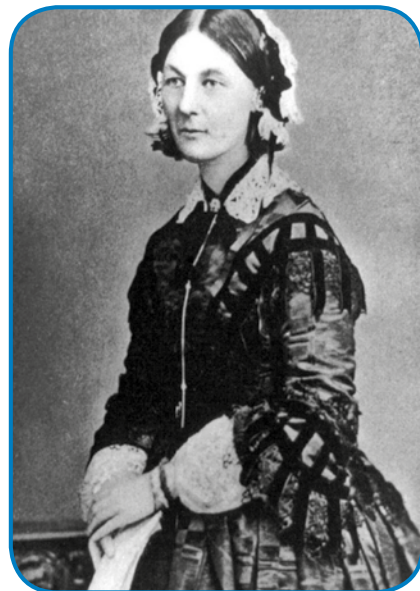
Florence Nightingale (1820-1910) je od medicinski sester zvün veukoga znanja terdjala moralno čistost tö - njeni rojstni den je grato »svetovni den medicinski sester« (12. majuš)

v Istambuli, delo je začnila s svojimi 38 odebranimi kolegarcami. Tistoga ipa so oprvim dopüstili, ka so ženske v sodačko službo staučile, pa če rejsan so leko sprvoga samo čistile, so