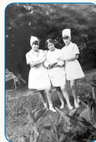
Nejšem stejla iglo primlati stran 8