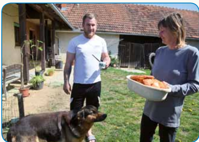
»Niške nas je nika nej gledo ali loviu« stran 4

»Boljše bi bilo, če bi bilo vse kot prej«