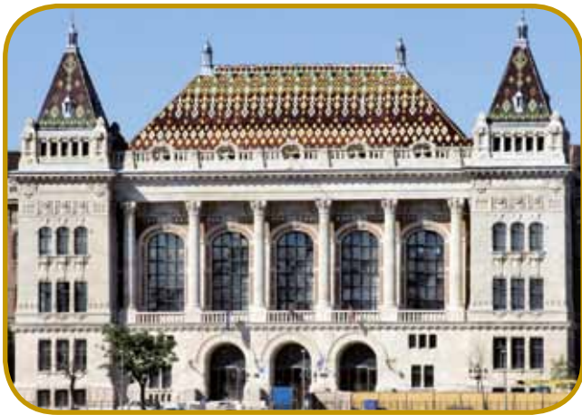
Centralna zidina Tehniške univerze - v leti 1871 je bila prva merarska šaula na svejti, štera je leko nosila tituluš »univerza«

telko lüstva kak pred petdeset lejtami, s svojimi skoro 900 gezero lidami je gratala prava svetska metropola. 70 procentov Peštarov je delalo v industriji ali povezano ž njauv, vsikdar več pa je bilau med njimi uradnikov ino vönavčeni lidi tö.