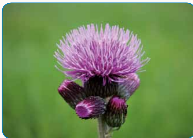
Pomlad na otkovskih močvirnih travnikih stran 6-7