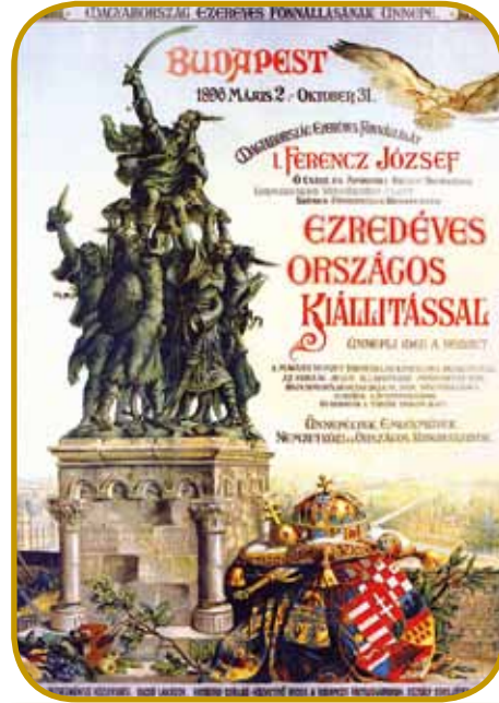
Leta 1896 so na Vogrskom držali »milenijske svetke«, ka so Madžari pred gezero lejtami med Karpate prišli

Nauvi moduš veseldja ino včenja - šteri je zdrüžo kejpa, gibanje ino glas - je grato film. Prvi madžarski film so gorvzeli o tom, kak je cesar Franc Jožef leta 1896 gorpoisko