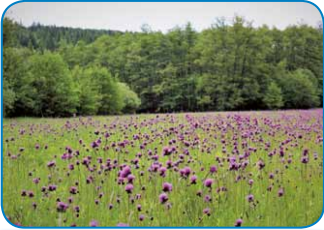
Travnik s potočnim osatom

porabsko pripovedovati, kako je bilo tu nekoč: vse, kar je zdaj gozd v bližini, so bile rodovitne njive, travnike so trikrat letno kosili, Porabje je bilo živo, predvsem pa slovensko. Tudi on je Slovenec, pridejo na dvoriške pa vse na nikoj dejejo ... Gotovo je s Porabjom ... Starci pomremo, mladi pa so tak Vougri. Skoro niške več ne guči po domanje, po porabsko ... Večer je padel na pisan travnik. Poslovlila