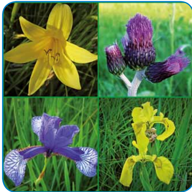
Rumena maslenica, potočni osat, sibirski perunika in vodna perunika

Ko se močvirni travniki na kakšnem metru višine barvajo vijolič-