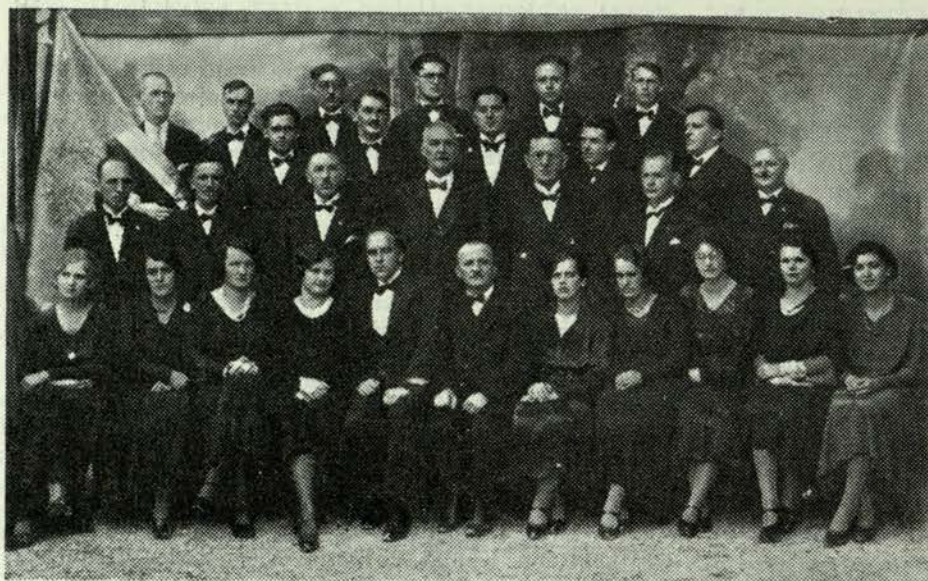
Zbor «Lira» ob zlatem jubileju društva.