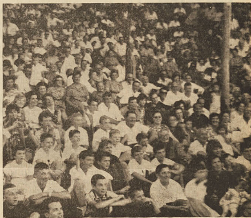
Pogled na množico, ki se je udeležila festivala «Dela» v Dolini.

Udeležite se polnoštevilno — Vstopnine ni