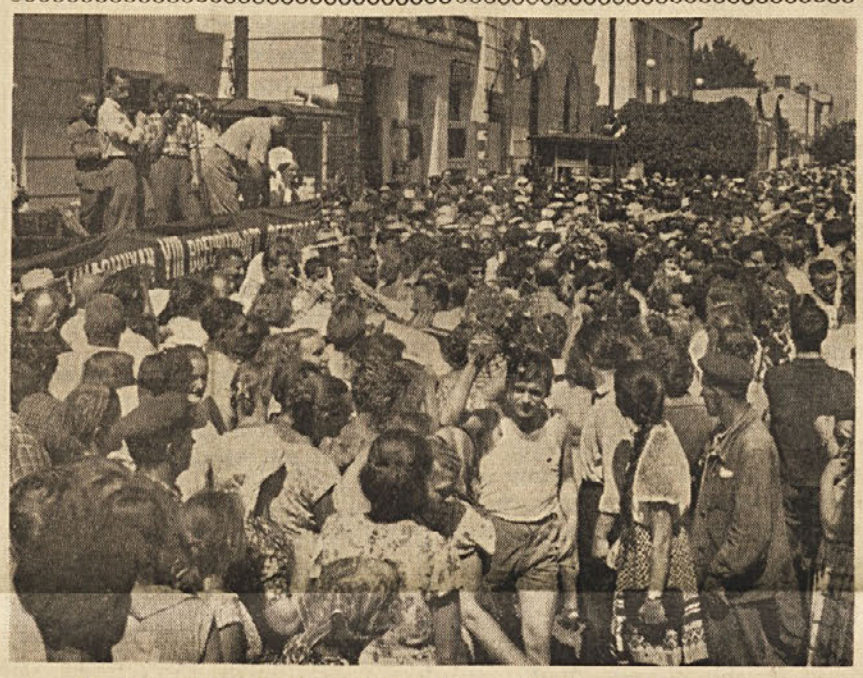
Pred kratkim se je v Helsinkih zaključil svetovni festival mladine. Geslo tega festivala je bilo: Mir in prijateljstvo! Festivala se je udeležilo nad 20.000 delegatov iz 142 držav. Za časa festivala je bilo v Helsinkih in v drugih mestih Finske več kot 1400 prireditev. Po zaključku festivala so delegati obiskali tudi razne kraje v Sovjetski zvezi, kjer so bili deležni navdušenega sprejema. Na gornji sliki: Sprejem na postaji v Moldaviji.

17. avgusta zapisal, da je «Aliansa za napredek Latinske Amerike», ki si jo je zamislil Kennedy, bila zadušena v pesimizmu. Omenjeni list je trdil tudi, da bo v najboljšem primeru potrebno več desetletij za njeno dejansko uresničitev. Vodilni razredi Latinske Amerike odklanjajo žrtve, ki jih zahteva ta aliansa. Revolucionarno vrenje v Latinski Ameriki obstaja in zelo čudno bi bilo, če se ne bi revolucionarni poskusi kubanskega tipa uresničili tudi še v kakšni drugi deželi. Danes zgubljam velike bitke, piše nadalje «Times», v Argentini, Peruju in tudi v Braziliji. To je potrdila tudi nedavna ekonomska konferenca v Braziliji.