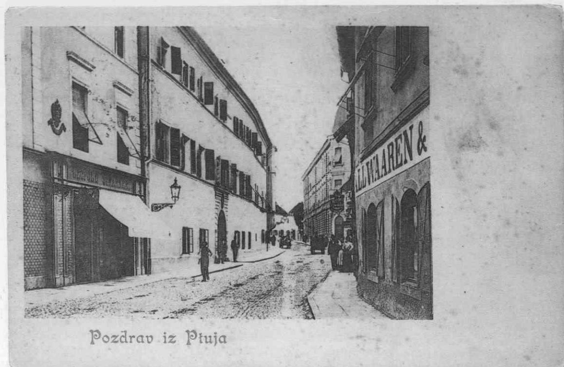
Lackova ulica z nekdanjo kasarno v osrednjem delu. Razglednico je založil J. N. Peteršič, odposlana pa je bila leta 1909