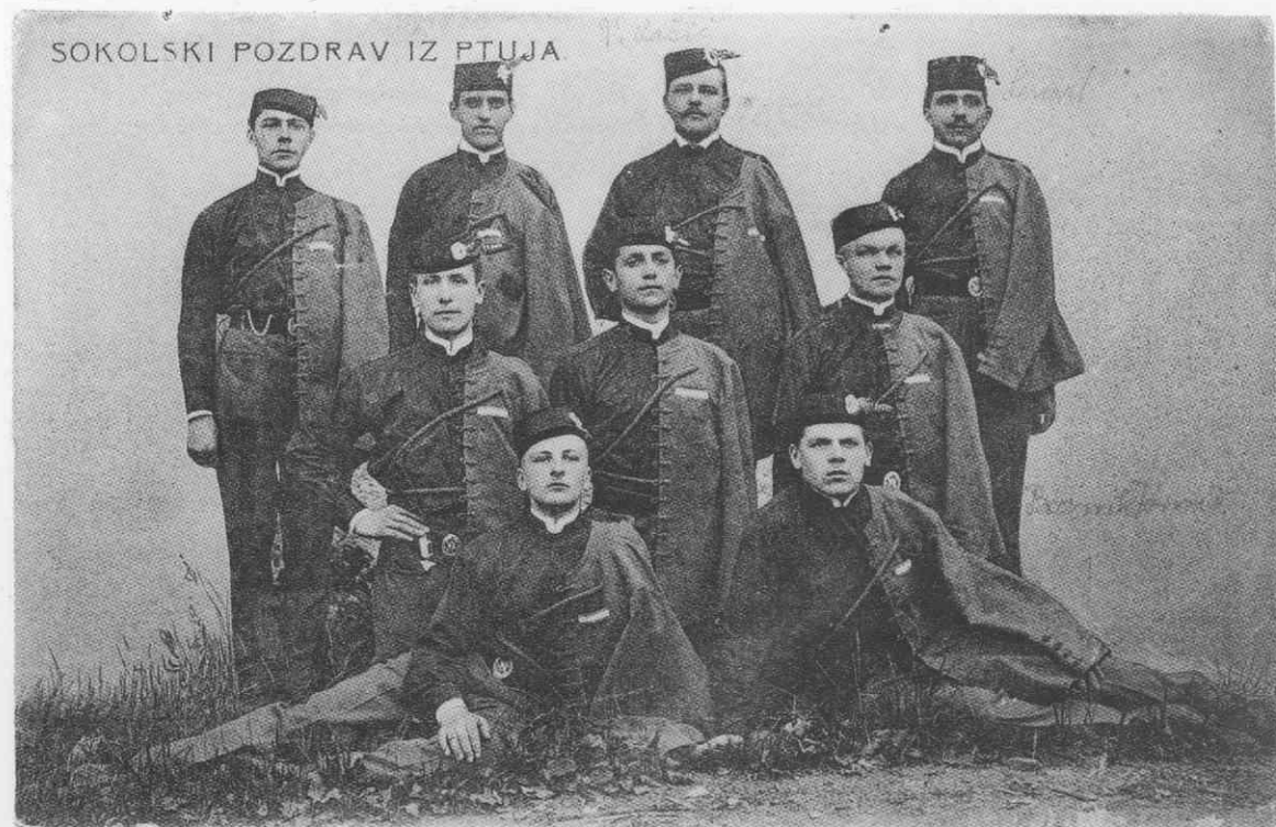
Sokoli. Razglednico je založil okoli leta 1910 U. Weixl