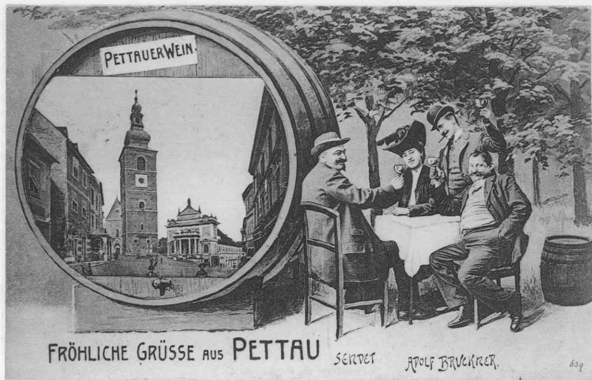
Razglednica, ki propagira ptujska vina. Leta 1907 jo je založil F. Knollmüller