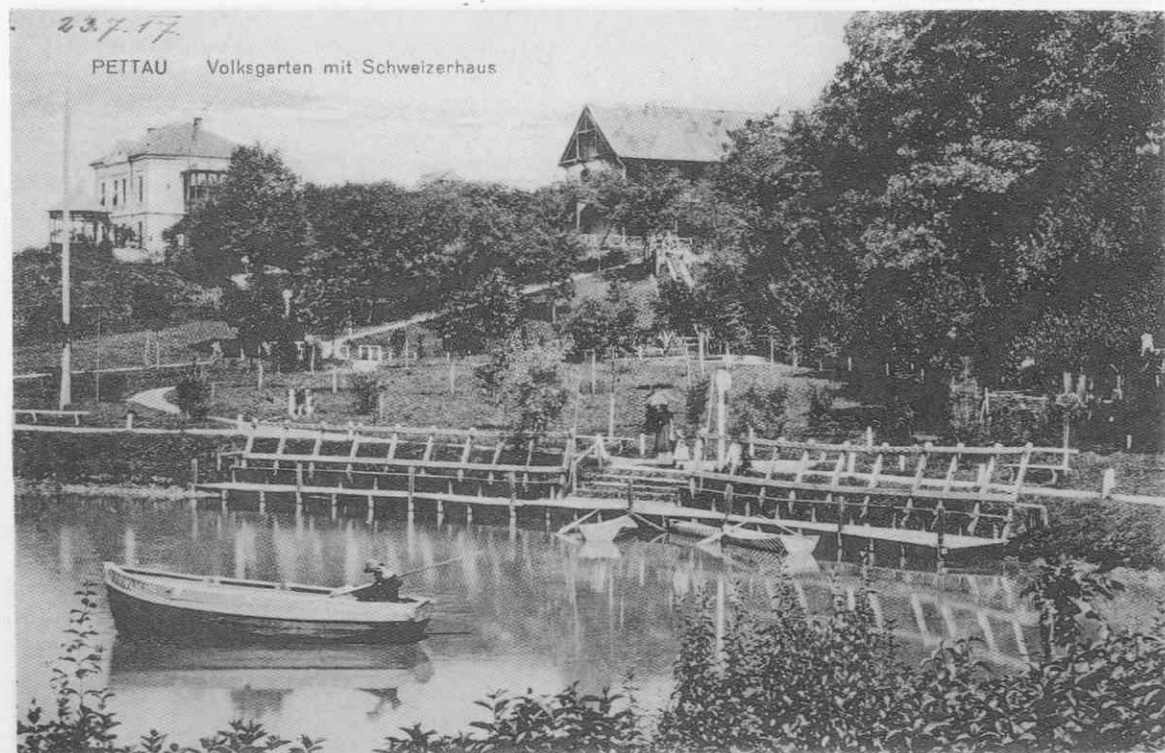
Ljudski vrt s Švicarijo. Založnik je W. Blanke, razglednica je bila odposlana leta 1917