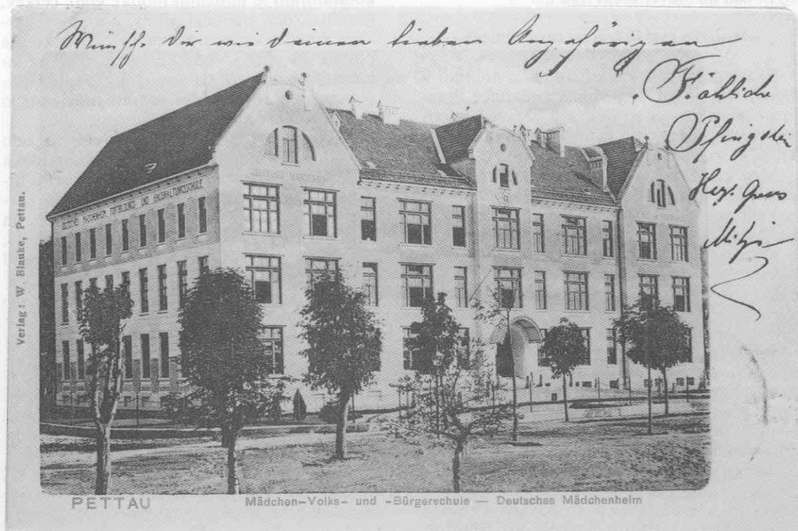
Mladika, fotografirana kmalu po izgradnji. Založnik razglednice je bil W. Blanke, odposlana pa je bila leta 1904