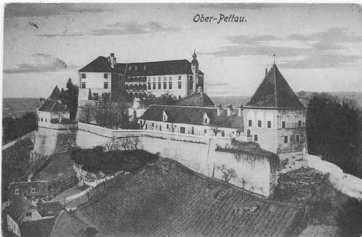
Najpogostješi pogled na grad; pod obzidjem je velik vinograd. Razglednico je založil W. Blanke leta 1917