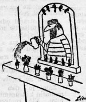
Zgodba brez besed