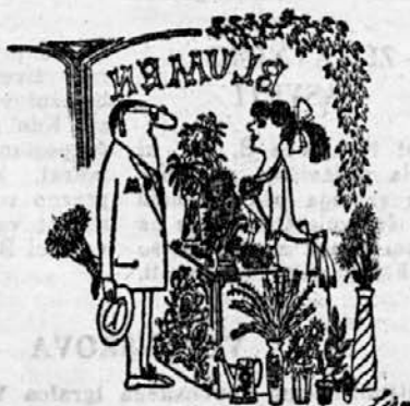
»Gospodična Zofija, majhno presenečenje imam za vas!«