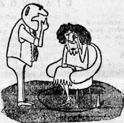
»Sumim, da ljubimkaš z mladeničem pod nami!«