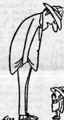
»Svaril sem te, Johnson, nikar se ne norčuj iz čarovnika!«