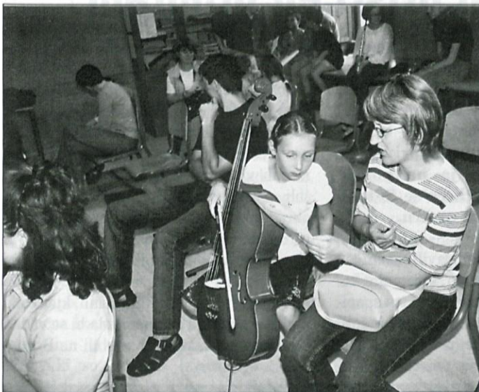
Mladi glasbeniki na Brdu so se predstavili.

Tako nekako bi lahko imenovali predstavitev, ki je bila na osnovni šoli na Brdu. Želje in mladostna zagnanost so drugačni od resničnosti in če iz ust tistega, ki igra na instrument, ki si ga naš najmanjši tako želi, slišimo, koliko ur vaj in kaj vse je potrebno za uspešno osvajanje glasbenega znanja, potem je naša odločitev toliko lažja.