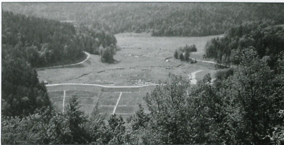
Suho Gradiško jezero privablja obiskovalce. Bojazni, da bi se utopili, pa ni!