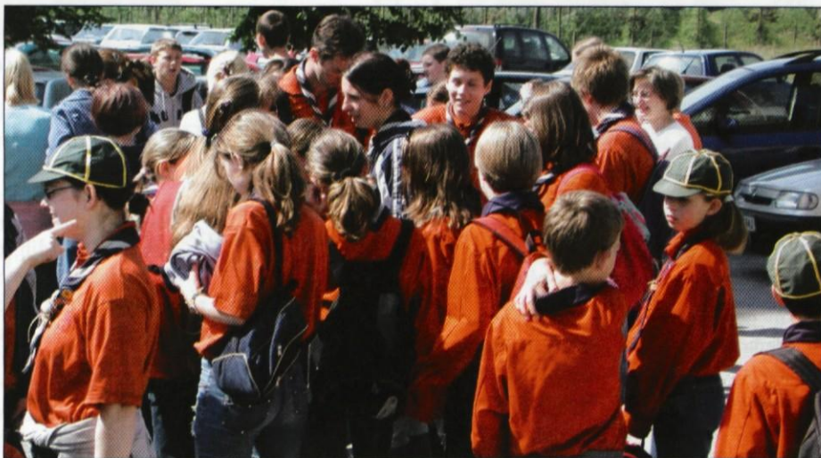
Dekanijskega dneva na Brdu so se udeležili tudi skavti.

O rganizacijski odbor za pripravo srečanja si je lahko oddahnil, saj sta lepo vreme ter množica udeležencev potrdila, da so se pri pripravi zares potrudili. Udeleženci srečanja, ki je bilo 24. maja na Brdu pod geslom Srce in roke župniji so prišli iz osemnajstih župnij dekanije Domžale.