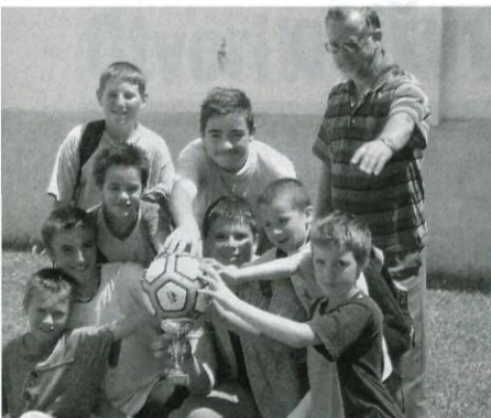
Pokal za prvo mesto gre v Krašnje.

Mengeš je bil tokrat gostitelj skupin ministrantov domažske dekanije. Pomerili so se na dveh popolnoma različnih področjih. Za prvo je bilo pomembno znanje za drugo vzdržljivost, malce sreče ter znanja. Ni pomembno, kdo je bil prvi, pomembno je bilo sodelovati. Pod tem geslom so ministranti pisali teste in se potem odpravili na igrišče, da pokažejo še nogometne vrline. Ker smo že zapisali, da ni pomembno, kdo je osvojil prvo mesto, saj so vsi zaslužili nagrado že, če so prišli na tekmovanje, pa vseeno zapišimo, da so domov v Krašnje iz Mengša ministranti prinesli poleg ostalega tudi pokal za osvojeno prvo mesto v nogometu. ↳ djd