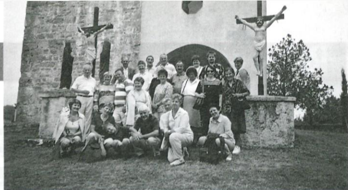
Pevci iz Krašnje v Goriških brdih pri cerkvi sv. Križa

Mešani cerkveni pevski zbor sv. Tomaža iz Krašnje se je 1. junija odzval povabilu na praznik češenj v Goriška brda. Brda so dežela