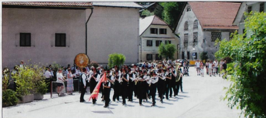
Svečanost v središču Lukovice