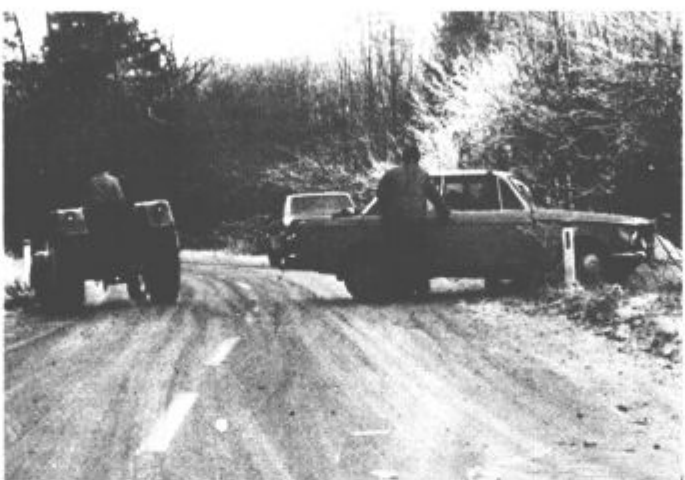
V tem času poledenele ceste marsikje pokažejo svoje zobe, kot na Mozirskem klancu. Zatorej: hitimo počasi! (vos)

Na občinskih, republiških prvenstvih je v različnih športnih panogah letos sodelovalo skoraj 3000 pionirjev, pionirk, mladincev in mladink iz osnovnih in srednjih šol velenjske občine. Alpske šole smučanja se je udeležilo 230 otrok, pionirske rokometne 75 pionirjev in pionirk, rokometnega tabora, ki sta ga pripravila ženski rokometni klub Velenje in Šoštanj, pa 121 učencev. Smučarskih veččin v zimski šoli v naravi na Slemenu, Paškem Kozjaku, v Zavodnjah in na Mozirski koči se je naučilo 727 učencev petih razredov osnovnih šol. Da jih vedno več tekmuje za športno značko, nas prepričajo naslednji podatki: v prvem polletju je prejelo 1133 učencev knjižice, 1371 značke in diplome, kar je v primerjavi s prejšnjim letom 23,6 odstotkov več. Zanimiv pa je tudi podatek, da se je različnih oblik športno rekreativne dejavnosti v devetih mesecih letos udeležilo več kot 6500 občanov.