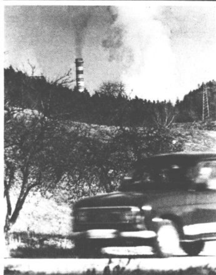
Hitrost in (še vedno) počasnost (pri reševanju ekoloških vprašanj)

nih organizacij in društev, ki jih je v Gornji Savinjski dolini preko 130, kar je glede na majhno število prebivalcev veliko. Veliko tudi zato, ker je teren močno razprostranjen, naselja odmakljena, veliko število je vozačev, študente in dijake pa so med tednom večinoma izven občine in ločeni od vsakdanjega dela in življenja. Kljub temu te organizacije in društva večinoma dobro delujejo, seveda na osnovi izključno ljubiteljskega dela in na zanesenjaštvu posameznikov. Ob vse bolj pičlih sredstvih za to dejavnost in ob vseh ostalih težavah je razveseljivo, da ta dejavnost v večini primerov ne upada. Razveseljivo predvsem zato, ker so vrline, ki jih družbene organizacije in društva razvijajo in krepijo, v današnjem delovnem in življenjskem utripu še kako in vedno bolj pomembne. Tudi in predvsem za boljše delo v krajevnih skupnostih, za boljše odnose in za sožitje med prebivalci posameznih krajev in vse doline.