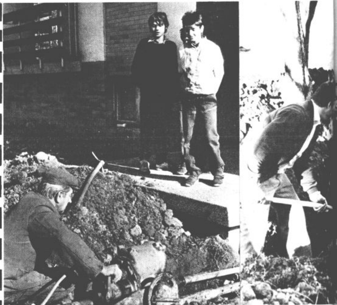
Kableska televizija trenutno največja akcija v krajevni skupnosti, (foto S. V.)

Poleg kableske televizije jo v referendumskem programu še izgradnja ceste Na griču, ditev peš poti skozi Hrastovje in še nekaj komunalnih zadev. Prva naloga je končana. Na griču so asfaltirali, mislijo