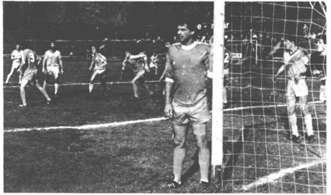
Igralci Rudarja so v zadnjih petih krogih dosegli pravi podvig (vos)

»Rudar ima vse selekcije, ki jih predvidevajo pravila nogo-