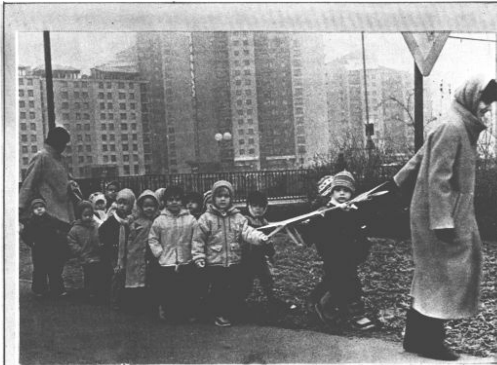
Še deset dni nas loči do koledarskega začetka zime. Po mrazu, ki te dni »reže do kosti«, to slutimo. Le snega noče in noče biti. Vendar pa, kot napovedujejo nekateri amaterski vremenoslovci, ga bo v drugi polovici decembra dovolj. Počakajmo, kmalu se bomo lahko prepričali.