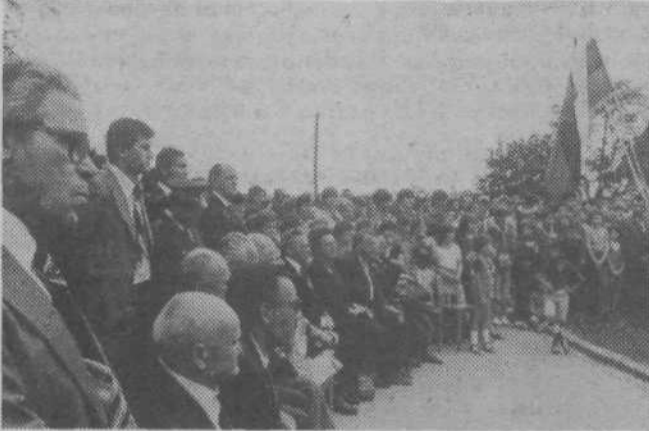
Gostje na proslavi ob odkritju spomenika ob združenem domu v Zadobrovi