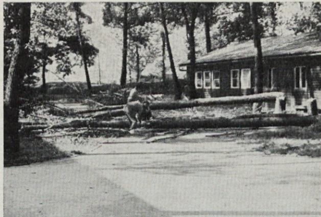
Tovarniški park se redči