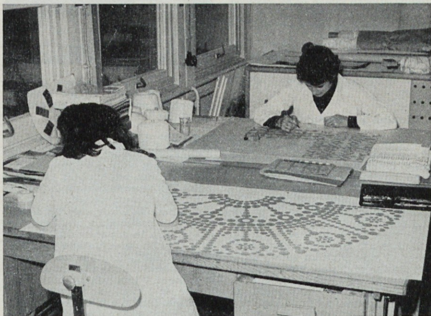
Pri oblikovanju vzorcev smo se opredelili za smer skandinavskih dežel. Za novo kolekcijo zaves smo izbrali sukljanke, ki so danes v Evropi spet zelo v modi

Na koncu nam je tov. Sešek dal tudi svojo oceno o novi kolekciji: Moje mnenje je, da je — glede na možnosti, ki jih imamo — uspela. Kako pa jo bo sprejelo tržišče, bomo videli pri prodaji.