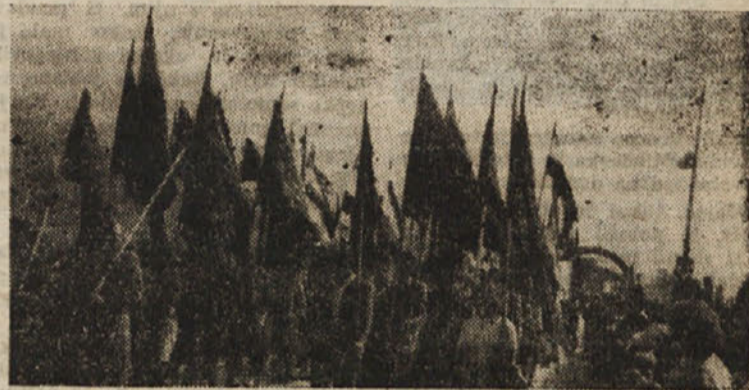
DELAVSKE ZASTAVE V SPREVODU

Ob zaključku so množice, poslane resolucijo maršalu Titu in pozdravno brzojavko koroskim Slovincem. France Bevk pa je ugotovil, kako so postavile mejnike med temno preteklostjo in srečno, svobodno bodočnostjo.