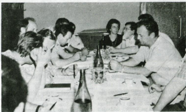
Delegati so na konferenci zavzeto raupravljali o sedanjem trenutku življenja in dela Logatca