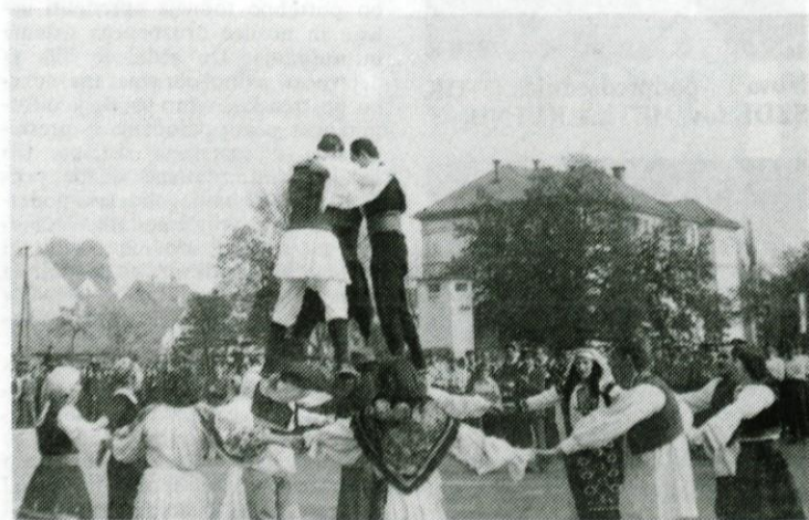
Folklorno društvo med enim svojih številnih nastopov