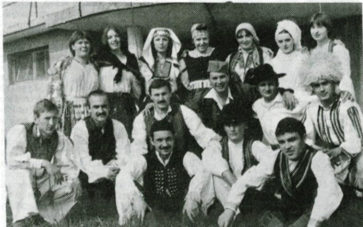
Folklorno društvo, rezultat sodelovanja med OO ZSMS Naklo in OO ZSMJ VP 9983

Tako šteje OK SZDL Logatec 31 delegatov. Prav tako pa imajo status delegata OK SZDL tudi delegati družbenopolitičnega zbora občinske skupščine.