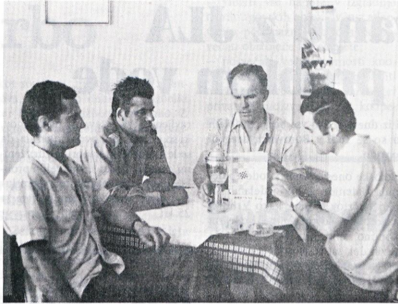
Vrhnikičani imajo največ dopisnih šahistov, zato so prejeli tudi pokal Sveta za dopisni šah. Lahko so ponosni nanj.