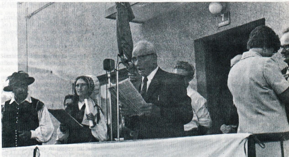
Razvitja prapora vrhniških čebelarjev pred KZ so se poleg čebelarjev iz domovine udeležili tudi gostje iz zamejstva. Predsednik slovenskih čebelarjev je spregovoril o pomenu čebelarstva in opozoril, da bo potrebno v čebelarstvu kot pomožni kmetijski panogi storiti še veliko.