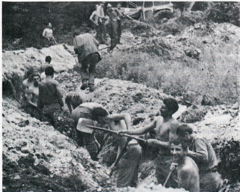
Pridne roke vojakov so izkopale v dveh dneh 1800 m dolg jarek. S to akcijo je bilo prihranjenih 60 milijonov družbenih sredstev.