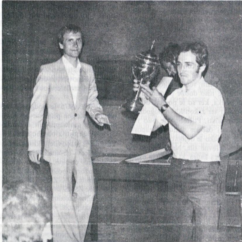
Na mladinski športni olimpijadi je zmagala Stara Vrhnika. Predstavnika OK ZSMS sta jim izročila lep pokal.