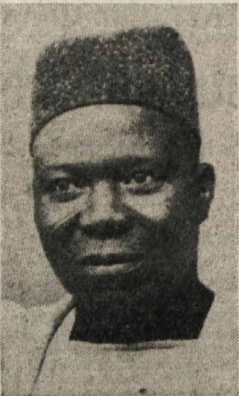
Bivši predsednik Zgornje Volte Sangole Lamizana

ABIDJAN — V Zgornji Volti je vojska pod poveljstvom polkovnika Sava Zerbe izvedla državni udar in odstranila predsednika Sangula Lamizana. Oblast naj bi prevzela «Vojska komisija za sanacijo in razvoj», ki je že ukinila ustavo in razpustila državno skupščino. Po prvih diplomatskih poročilih iz glavnega mesta Zgornje Volte Ouagadougou, naj bi vojska izvedla državni udar brez večjih spopadov. Zgornja Volta, bivša francoska kolonija, spada v skupino osemnajstih najbolj revnih držav in ima približno šest milijonov prebivalcev. Samostojna je postala leta 1960, po nekajletni notranji nestabilnosti je leta 1965 prevzel oblast z državnim udarom sedaj odstavljeni predsednik Lamizana. Ta je sicer nato izstopil iz vojske in se predstavil na volitvah, na katerih ga je prebivalstvo izvolilo za predsednika. Že nekaj časa pa se je predvsem v voljskih krogih kazalo nezadovoljstvo, s pičilim razvojem gospodarstva, kar je bil verjetno eden od glavnih vzrokov državnega udara.