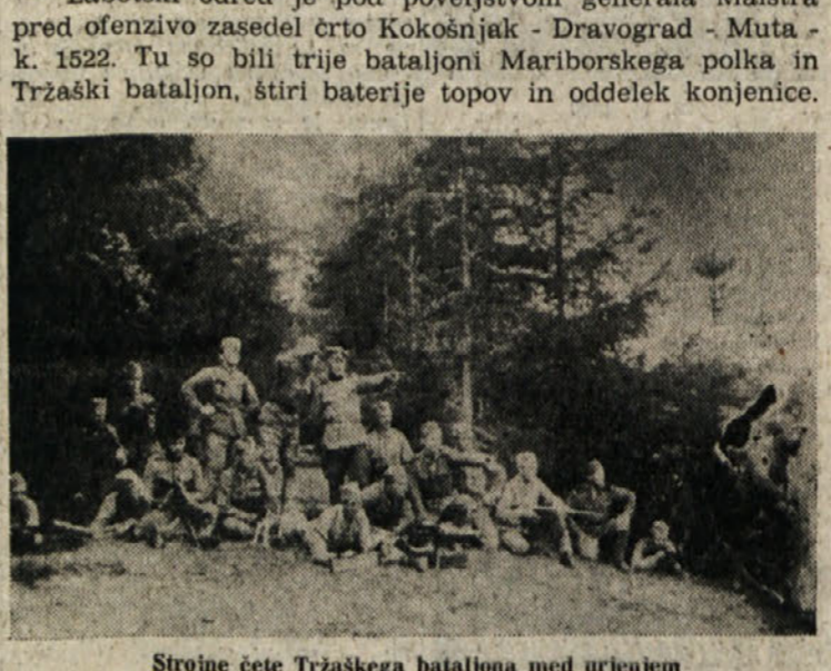
Strojne čete Tržaškega bataljona med urjenjem

sabo zapuščale bežeče enote, ki so že kazale znake razpadanja. Po naslednjih so mnogih hišah visele bele zastave. Avstrijci so že drugi dan predlagali prekinitve sovražnosti in sklenitev premirja. Jugoslovansko poveljstvo je ta predlog sicer sprejelo, toda pod pogojem, da se operacije nadaljujejo vse do podpisa pogodbe. S tem so preprečili avstrijsko ukano in napredovanje jugoslovanskih enot se je nadaljevalo. Delegati ene in druge strani so se sestali 2. junija v Kranju. Labotski odred je pod poveljstvom generala Maistra pred ofenzivo zasedel črto Kokošnjak - Dravograd - Muta - k. 1522. Tu so bili trije bataljoni Mariborskega polka in Tržaški bataljon, štiri baterije topov in oddelek konjenice.