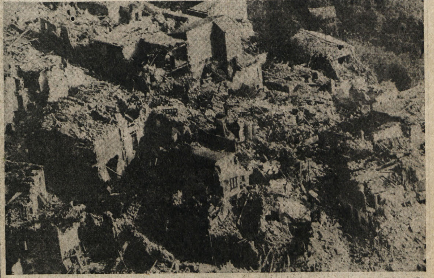
Kraj San Mango sul Calore, v neposredni bližini epicentra potresa, je skoraj popolnoma porušen

Po podatkih, ki so jih prefektura posredovale notranjemu ministru, so izpod ruševin doslej izkopal 2.400 trupel - Reševalne skupine še niso prišle v nekatere manjše gorske vasi - Številne solidarnostne akcije po vsej državi