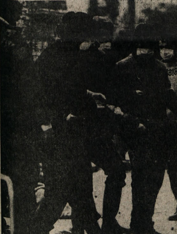
Vojak in prostovoljci nosijo truplo otroka, ki je umrl med ruševinami cerkve v Balvanu

Kazalo bi morda, podati kratko sliko prizadetega območja in posameznih občin. Območje, ki ga je potres razdeljal in ki so ga v preteklih dneh fotografirali letala vojaškega letalstva je dolgo kakih 140 km, široko pa 80, obsega pa pokrajine Potenza, Benevento, Caserta, Neapelj in Salerno, medtem ko je pokrajina Avellino prav na sredi tega območja. Popolnoma so bile porušene vasi Laviانو (2200 prebivalcev), Coglianu (4200), Castellnuovo di Conza (1036), Santomena (1000). Vse te vasi so v pokrajini Salerno. Hudo prizadete so bile vasi Salvitella (1100), Lioni (5800), Monotero Inferiore (7600), Monotero Superiore (5400), Sant'Angelo dei Lombardi (5200), San Michele in Serino (1600), Balvano (2300), Pescopagano (3346) in Muro Lucano (8070). Pas, v katerem ležijo hudo prizadete ali povsem porušene vasi obsega grčevnato območje in visoko planoto med Potenzo, Avellino in Salerno, ter je že leta v hudi gospodarski krizi. Potres je čez noč zbrisal tudi tisto, kar so dosegli s pomočjo blagajne za Jug in z deviznimi sredstvi, ki jih pošiljajo tujski delavci na začasnem delu v tujini.