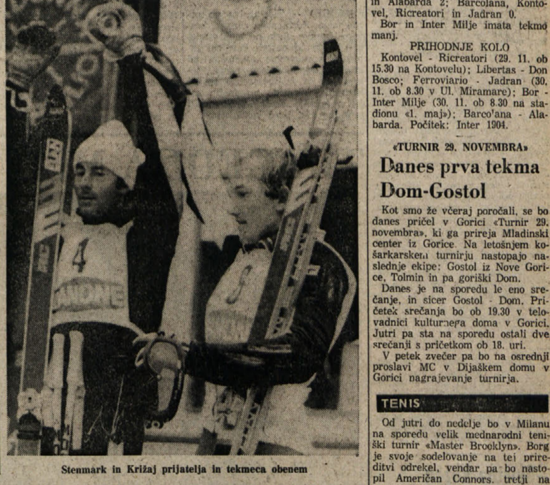
Stenmark in Krizaj prijatelja in tekmeca obenem

MLADINCI Volley club — Bor 2:3 (—3, —7, 12, —14) BOR: Ferluga, Stancić, Kalc, Tul, Pernarčić, Dewalderstein, Bačić. Mladinci Bora so pospravili trije prvenstvene točke. Skromni Volley club so sicer premagali precej teže, kot je bilo pričakovati in kot je kazal tudi sam začetek srečanja. Ne glede na to, da so morali borovci na igrišču v okrenjeni postavi in z dvema se poskodbovanima igralcema, je bilo na dan, da se tehničnega kot tudi taktičnega vidika. Po dveh razmeroma lahkih delnih zmagah se je najlepše pokazalo v nadaljevanju. Slovenski fantje so grešili kot za stavo, da