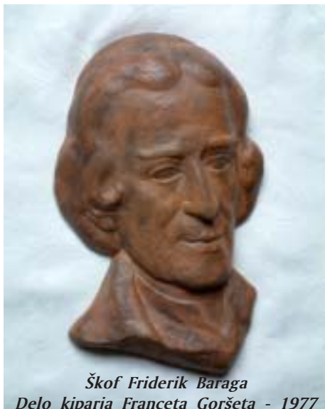
Škof Friderik Baraga Delo kiparja Franceta Goršeta - 1977