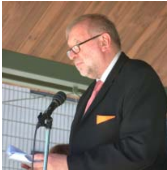
dr. Dimitrij Rupel, Minister za zunanje zadeve RS

Ta država je danes, ko so se spet zbrale energije nekdanjega Demosa, postala članica