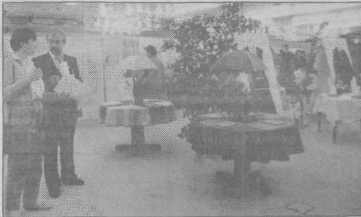
Prizor z razstave Tekstil za turizem v Cankarjevem domu

skovni konferenci za novinarje. V tej trgovinski delovni organi-