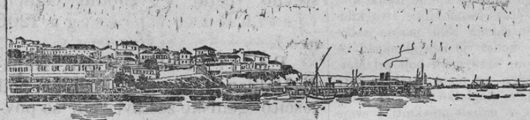
Die bulgarische Hafenstadt Varna am Schwarzen Meer.

Čenjeni naročniki. Nastopilo je novo leto in usojamo si uljudno cenjene naročnike vabiti na zopetno naročenje „Štajerca“.