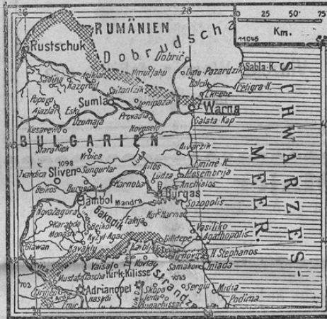
Zur Beschießung Warnas durch die russische Flotte.

Bolgarsko pristaniško mesto Varua je gla- som nekega poročila iz Konstanze bilo od rus- kih vojnih parnikov obstreljevano. Utrdbe Varne