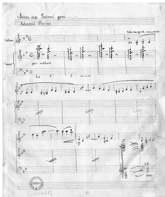
Slika 7: Bojan Adamič, Mesec (= Noč) na Travnih gori za violino in klavir (orig. rkp., 1944; hrani NUK – Glasbena zbirka), str. 1.