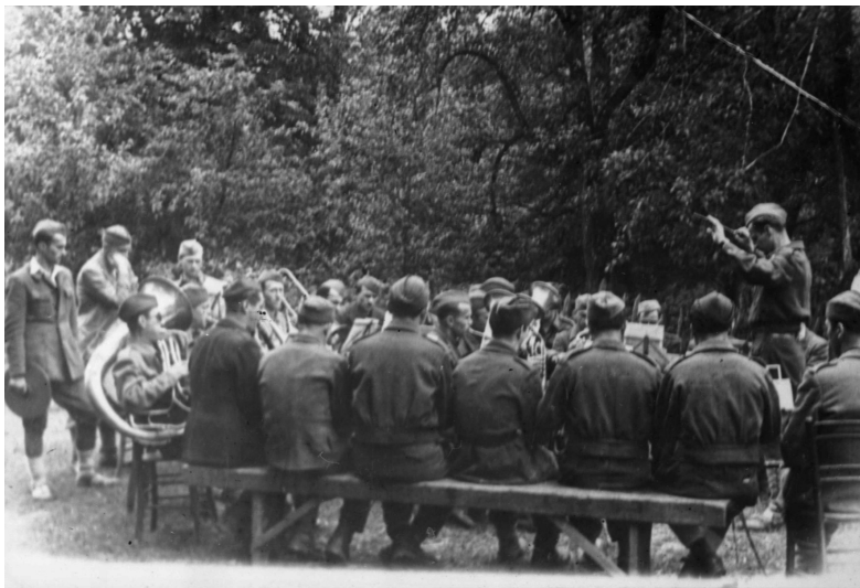
Slika 13: Adamič dirigira Godbi GŠ NOV in POS (avg. 1944), v zasebni lasti.