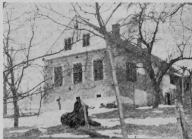
Hiša vzbuja videz, kot da v njej ni življenja. Res ga ni, oziroma je, samo človeško ne.

Verjemite ali ne, pekla nas je vest. Sčeli smo v razkrošenem hotelu na turški kupili smo malico in se še