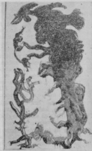
Troglav (tehnika — emajl na plastiki)