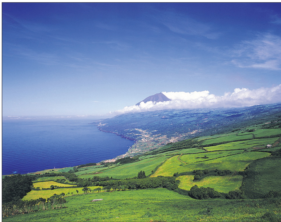
Vulkanski mogotci pred obalo otoka Pico