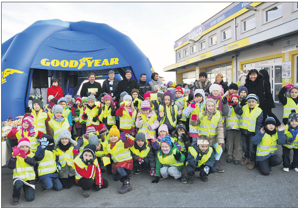
Pred Tuning centrom so se zbrali učenci Osnovne šole Ljudski vrt s predstavniki podjetja Goodyear Dunlop Sava Tires in županom mestne občine Ptuj.

srca zahvalil in poudaril, da je to pomemben prispevek k ozaveščanju in zavedanju, da je težka noga v osebnem avtomobilu lahko za vsakega od nas usodno nevarna. Varnost v prometu je tudi ena od prioritarnih nalog v MO Ptuj, kjer prek varnostnega sosveta skrbijo za to, da bi bilo čim manj prometnih nesreč, še posebej tistih s hudimi ali tragičnimi posledicami. Vse otroke pa je pozval, naj tiste voznike, ki bodo mimo merilca vozili prehitro, na to tudi opozarjajo.