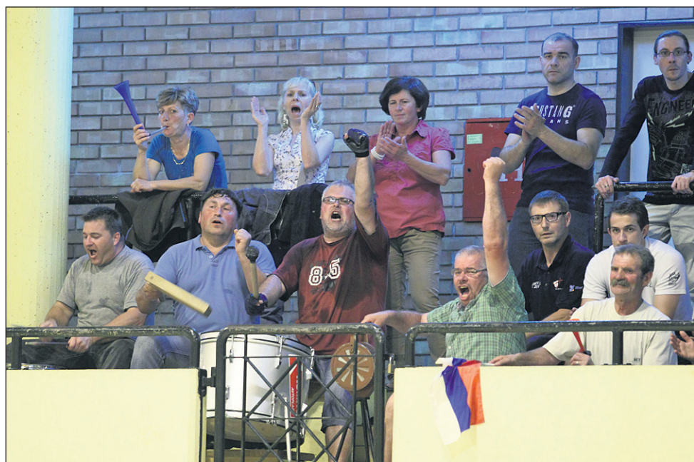
Navijači so lahko v sredo v dvorani Ljudski vrt pomemben dejavnik za morebitno zmago ptujskih rokometišev.

»Naši fantje se bodo pomerili s tekmeccem, ki bo sicer v vlogi favorita, a to je le na papirju. Z lanskoletnimi izkušnjami, polnimi tribunami in