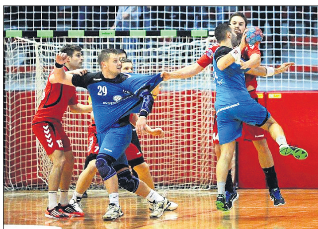
Ormožani (v modrih dresih) so na Kodeljevem proti okrepljenemu Slovanu nekoliko nepričakovano osvojili popoln izkupiček.