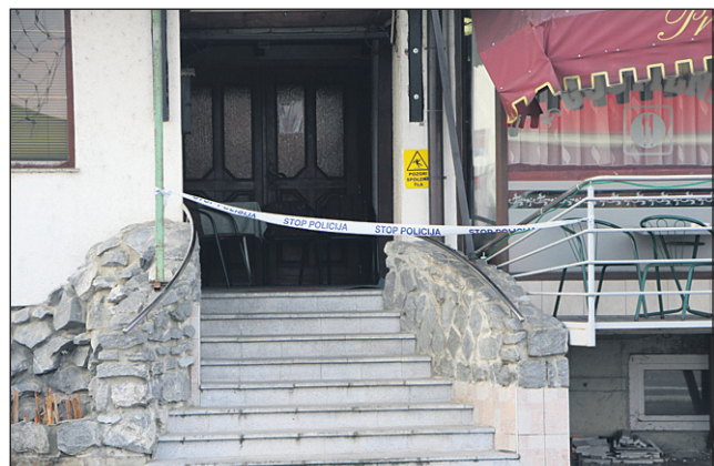
Poslovni objekt na Dornavski cesti, v katerem se je zgodil umor, je od petka zapečaten.