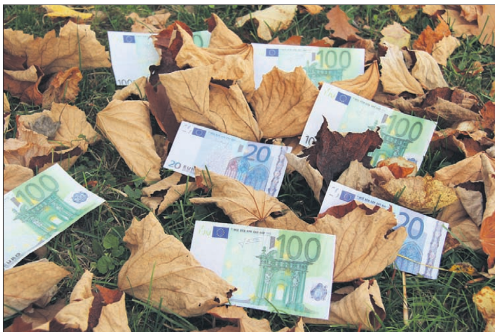
Najava osmega poziva za koriščenje preostanka denarja iz RRP je bila nepričakovana; zaradi pogojev, ki so postavljeni, se zna zgoditi, da bo marsikatera občina ostala brez lepega kupa denarja, s katerim je nameravala naslednje leto sofinancirati svoje projekte. (Fotografija je simbolična).

Tudi občina Ormož bo kandidirala s projektom gradnje vrtca, in sicer pri Veliki Nedelji. Investicija je ocenjena na 1,3 milijona evrov. Toliko sredstev je Ormožu po razrezu sredstev za RRP ostalo do konca tega proračunskega obdobja. »Zato smo mnenja, da nam jih vlada nima pravice vzeti ter jih s prevaro dati drugim. Pravomočno gradbeno dovoljenje imamo, izvajalca žal nimamo izbranega, saj nismo vedeli za načrtovan razpis. Lahko bi razpis za izbiro