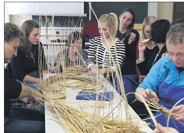
Na delavnicah so med drugim pletli košare prijateljstva.