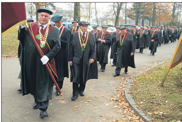
Okoli 150 slovenskih vitezov vina se je v redovnih oblačilih ter s praporom na čelu najprej podalo na kidričevsko tržnico.

Poudaril je, da je vinogradništvo slovenska preteklost in hkrati razvojna priložnost,