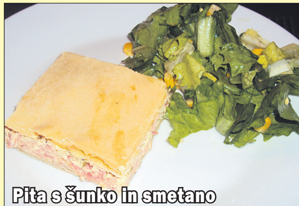
Pita s šunko in smetano