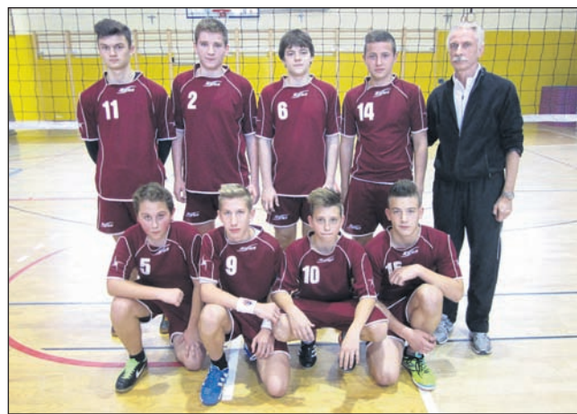
Odbojarska ekipa OŠ Markovci je zmagala na medobčinskem prvenstvu.

V Cirkulanah je v ponedeljek, 2. 12., potekal finalni del medobčinskega tekmovanja v odbojki za učence letnika 1999 in mlajše. Naslov so osvojili učenci OŠ Markovci, ki so slavili pred OŠ Videm-Leskovec, obe šoli pa sta se s tem uvrstili na območno tekmovanje.