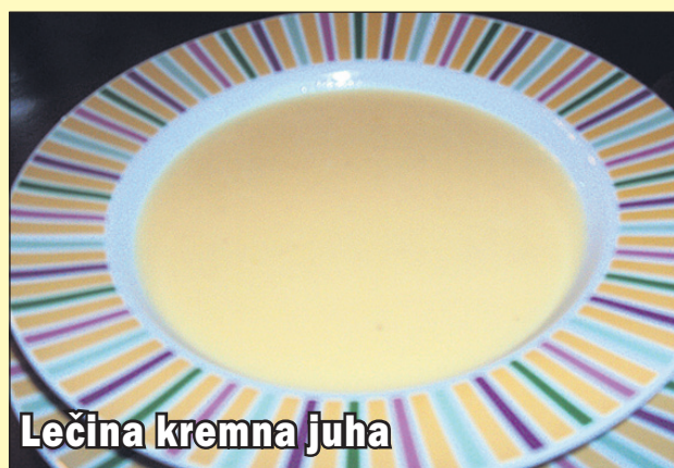
Lečina kremna juha