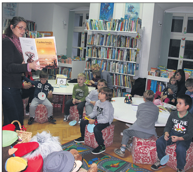
Vsako prvo in tretjo sredo v mesecu lahko otroci v Knjižnici Ormož prisluhnejo pravljici.