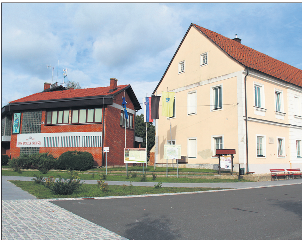
V občini Središče ob Dravi bo v prihodnjih letih pri odhodkih iz občinskega proračuna treba konkretno zategniti pas.