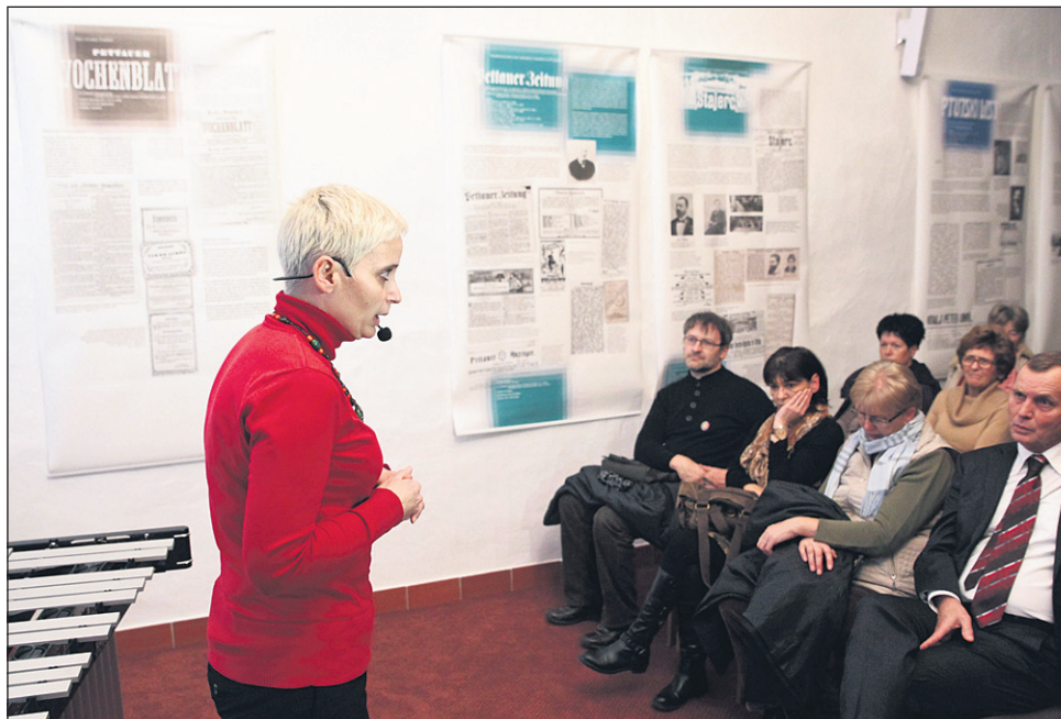
Po vzoru ptujske knjižnice poteka bralna značka za odrasle tudi drugje po Sloveniji.