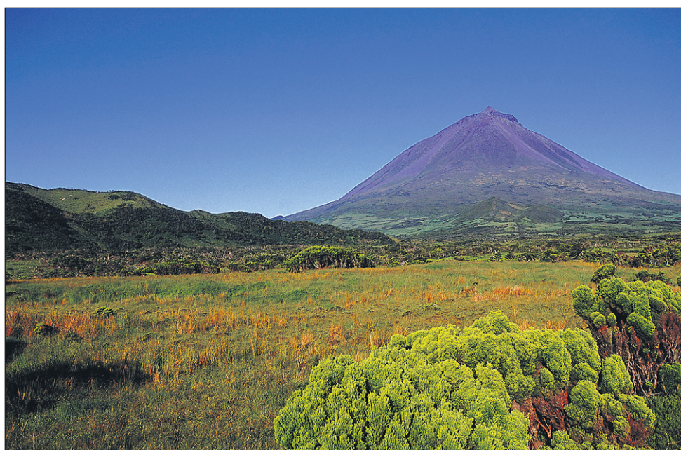
Pravilnična pokrajina na otoku Pico in v ozadju otok Faial