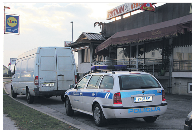
Policisti, forenziki in kriminalisti se s preiskavo od petka dalje intenzivno ukvarjajo.