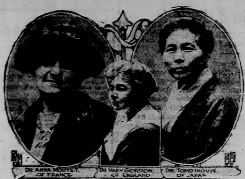
TRI UGLEDNE ČLANICE, KI SO ZASTOPANE NA MEDNARODNI KONFERENCI ZDRAVNIC.

Polje tirale prinese "Uradni list" tudi se kaj drugega pametnega in koristnega. Čudno pa je, da postopa pri tem pristransko in zavlačuje objave gotovih uradnih navedb. Tako je prinesel v neki številki naredbo glede znižane vozne cene na železnicah za posetnike toplje, ni pa do danes še objavil — po poročilih drugih listov — je raj mesec staro naredbo glede brezplačne vožnje invalidov na železnici. Tudi že precej staro, po nekaterih drugih časopisih objavljeno naredbo glede draginjskih Jektid javnih uslužbenec in upokojencev "Uradni list" do danes še ni prinesel. To je najbrže-