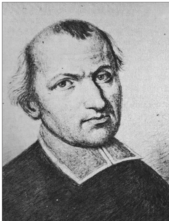
Francišek Maksimilijan Vaccano (Tavano in Dolinar, Vaccano, str. 531).

no je na čelu ribniškega arhidiakonata ostal vse do leta 1643, nato pa je opravljal številne visoke službe. Tako je bil med drugim pičenski škof, ljubljanski stolni prošt in tržaški škof. Umrli je leta 1672 v Trstu, kjer je v stolnici tudi pokopan. 4