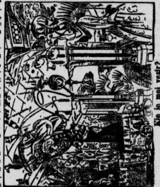
Kje je moj veštr?

Hiše treznega in poštenega HLAPCA ki bi bil uporaben tudi za vinsko klet, v starosti od 25 do 40 let. — Plača po dogovoru.