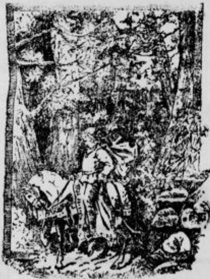
Kje je Alenčica?

Portugalski kralj je obiskal Pariz. Zelo strastno je igral čelo in bi bil rad videl, kakšno sodbo ima visokospoštovani Rossini o njegovi igri. Povabil je mojstra k sebi, mu igral ter ga potem vprašal: »Torej, kaj rečete o mojem igranju?« Rossini je prijazno prikimal in dejal: »Hm, za kralja še ni tako slabo. Vrh tega pa vemo, da smejo vladarji narediti kar hočejo.«