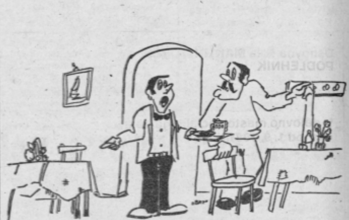
— Kakšna nesramnost, pred eno uro je možakar pri tej mizi naročil hrenovko in pivo, sedaj ko prinesem, pa ga ni več ...