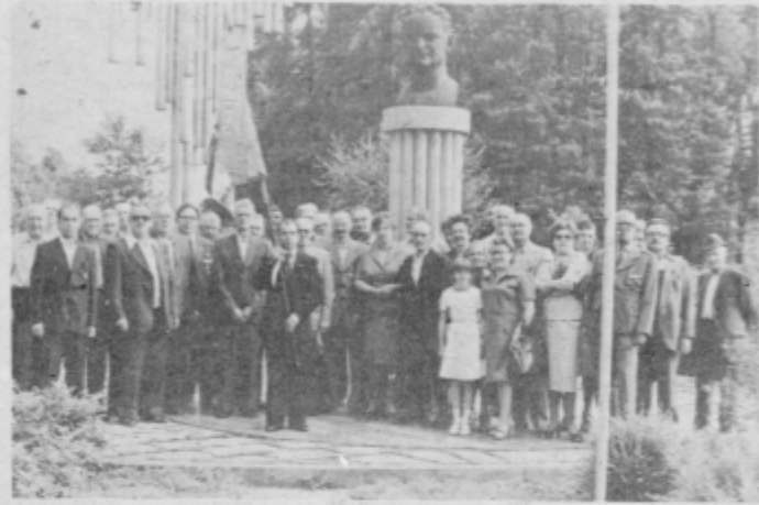
Člani ZZB NOV Kidričevo pred spomenikom Borisu Kidriču