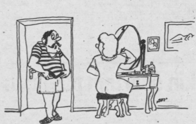
Uh, ta vročina. Poglej, sinoči sem še imel nekaj denarja v žepu, čez noč pa mi je izhlapel