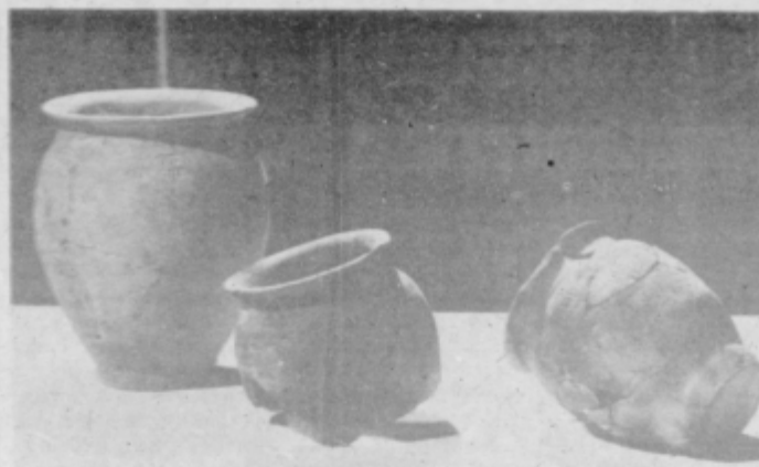
Žare z žigi izdelovalcev