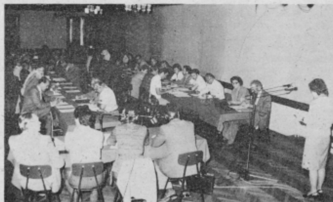
Delegati zborov SO Ptuj na skupnem zasedanju