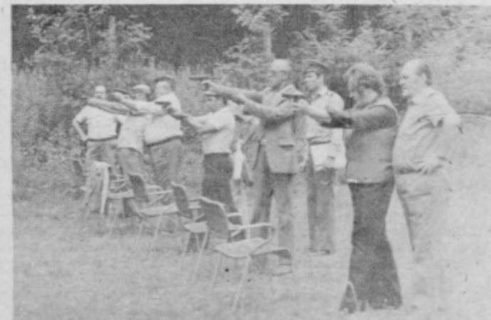
ZZB NOV med tekmovanjem — streljanje s pištolo