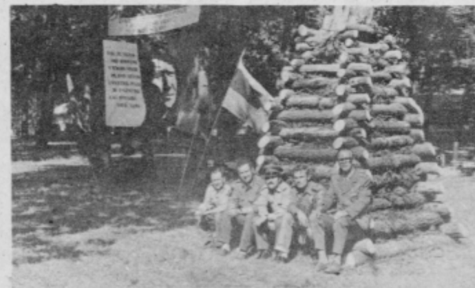
Predstavniki JLA in vodstvo taborniškega odreda