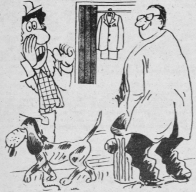
— E, stric, stranišče je tam zadaj! — Nič zato, če je tu dobro za mojega psa, bo tudi zame ...