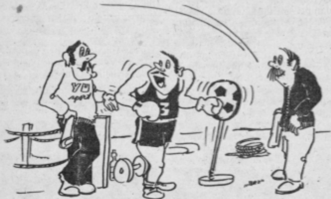
— Ali bi hoteli pristopiti k Ptuju sedaj, ko se je uvrstil v enotno slovensko ligo? — Najprej mi povejte, če sploh imate črni fond!?

MOŠKI: Posmeh in sum vas bosta zalila. Odrasel in zrel mož se, znali se boste obvladati in z molkom odgovarjali izzivalcem.