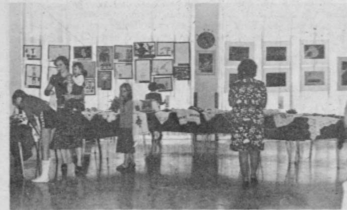
Razstava likovnih in ročnih del