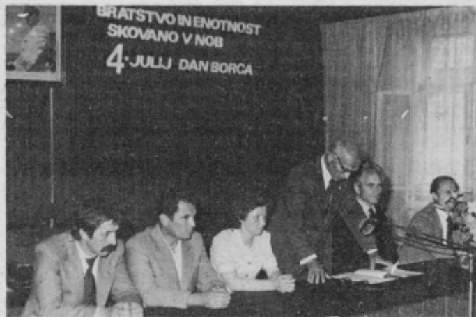
Delovno predsedstvo na slavnostni seji