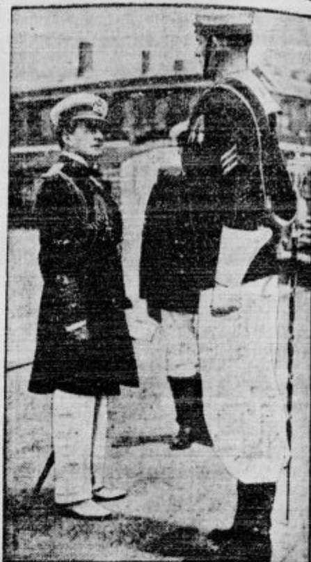
Največji tambor-major v angleški mornarici Hammond pred vrhovnim poveljnikom britskega brodogojstva admiralom Beatty-jem, ki si je dal moža predstaviti

Skladišče dinamita je zletelo v zrak blizu Hirošime na Japonskem.