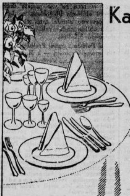
V. J. 4. - 34.