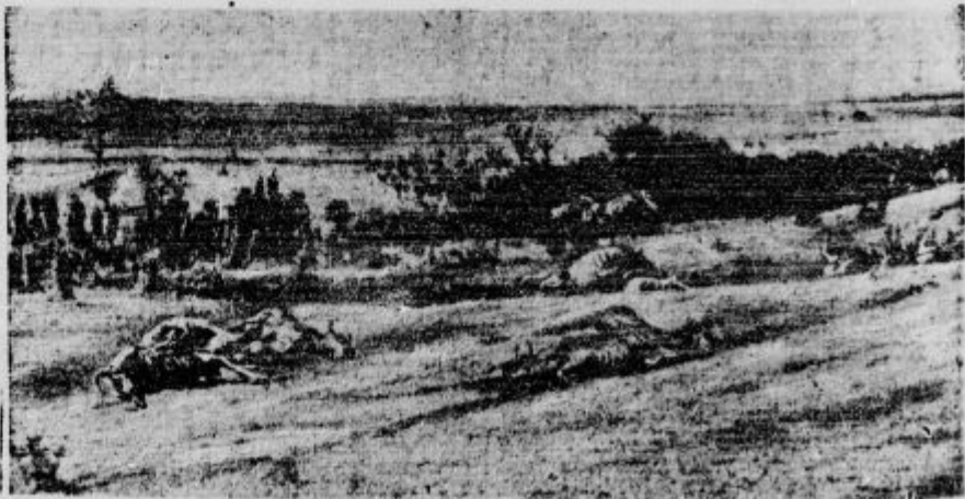
Strašna suša v Ameriki: Prizor s pašnika v državi Oklahoma, kjer cepa živina od žeje in lakote.

Obleke iz papirja so začeli nositi v Ameriki. Obleke vzdržijo baje tri mesece.