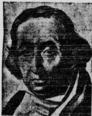
Jožef Marija Jacquard, ki je l. 1808. iznašel prvi tkalni stroj. Umrl je 7. avgusta 1854.

Šivalni stroj ni tkalni stroj, to ve vsakdo, ali da morete tudi na šivalnem stroju izdelovati tkanini podobne izdelke, to ve malokdo. Prepričajte se sami in še danes zahtevajte pri svojem trgovcu, da vam postreže z najnovejšim izumom PST Patent Stopf Twist pripravo, ki omogoča krpanje perila na šivalnem stroju z enostavnim šivanjem naprej in nazaj mnogo hitreje in lepše nego na roko.