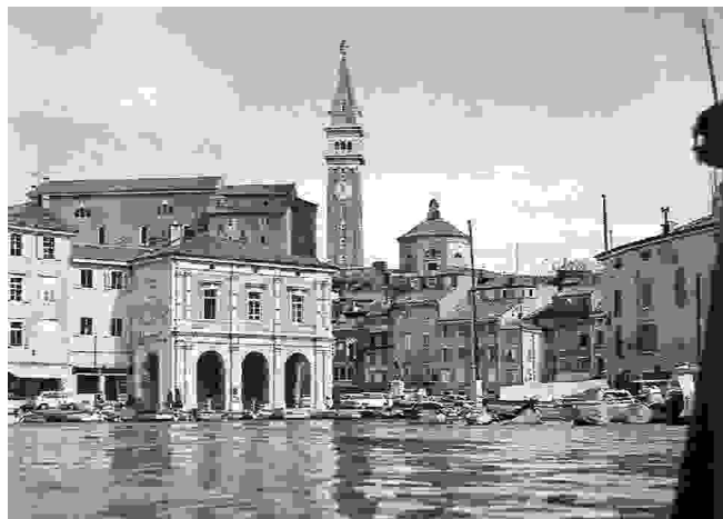
Piran; pogled z morja na Tartinijev trg

Med obema vojnoma je bil Piran pod Italijo, po 2. sv. vojni se je veliko Italijanov izselilo, leta 1954 pa je bil priključen Jugoslaviji, to je Sloveniji.