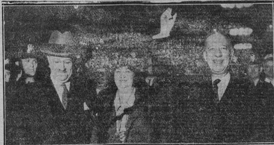
Znani demokrat Al Smith, ko je nedavno s svojo soprogo obiskal Chicago, kjer je bil časten gost na svetovni razstavi. Na tisoče ljudstva je navdušeno pozdravljalo tega bivšega predsedniškega kandidata.